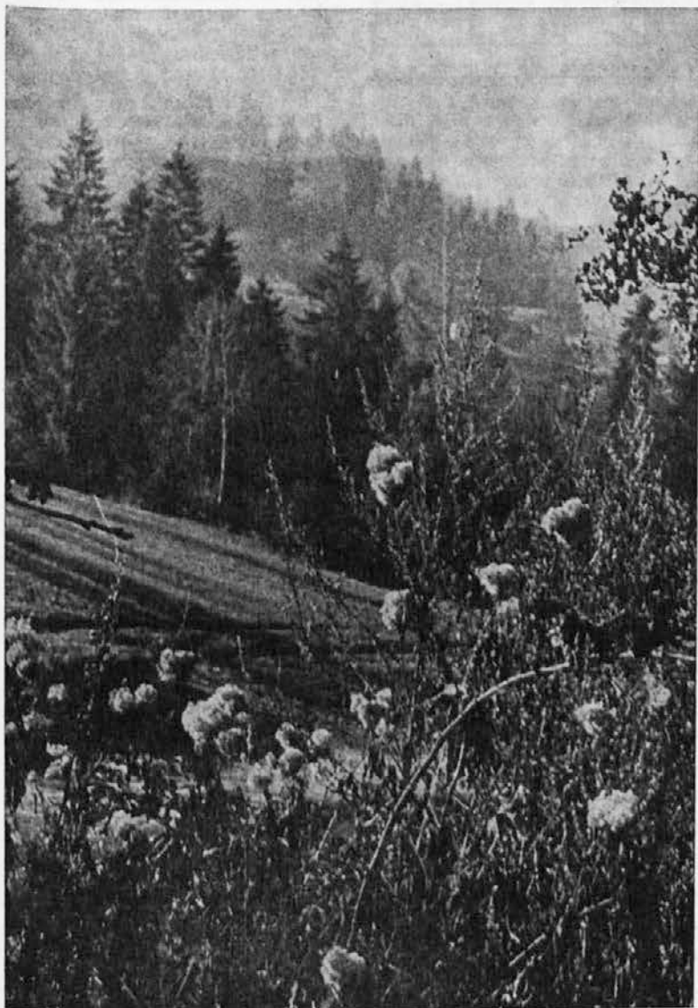
Ko jesen zacveti