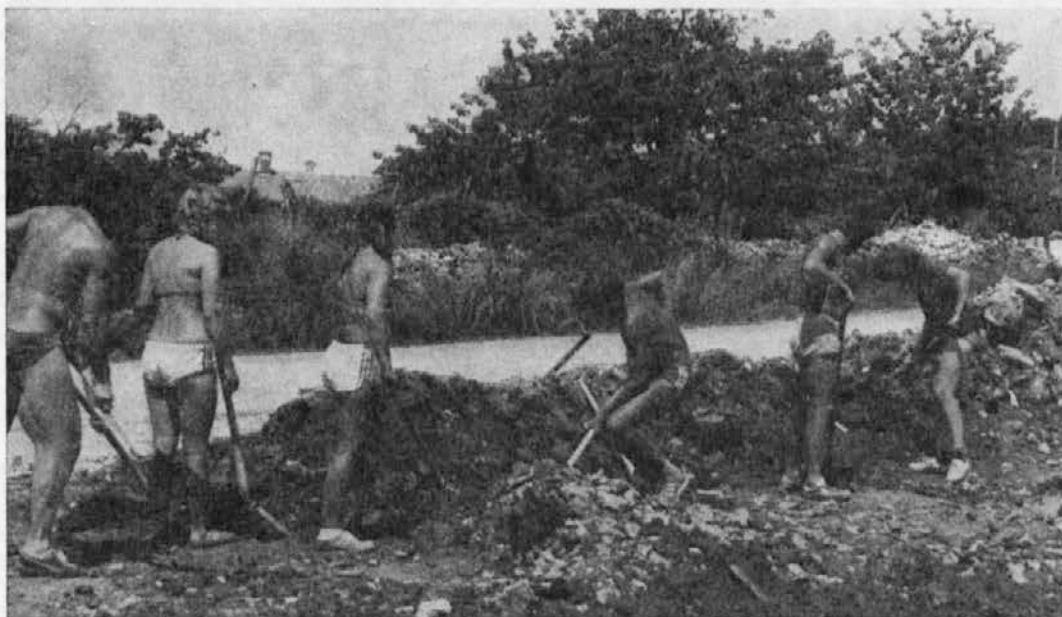
Korošci na MDA Istra 81