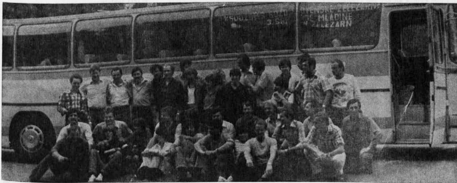
Počitek v Kragujevcu