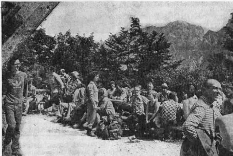
Spomin na pohod

Društvo upokojencev Velenje je skupaj z društvom upokojencev Ravne priredilo 12. avgusta piknik na Navrškem vrhu. Udeležilo se ga je 50 upokojencev iz Velenja in 50 z Raven. Za prehrano, imeli so štiri na žaru pečene