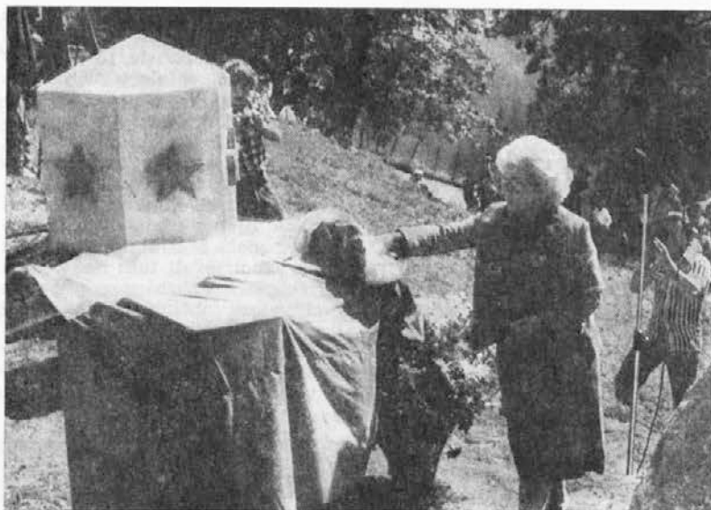
Ob odkritju spomenika v Topli

kadrovsko dopolnitev verjetno ne bo, zato pa bo treba znatno več dela vložiti v kadrovske priprave za delegatski sistem. Odločili smo se namreč za posebne delegacije, zato je treba v pripravljanih postopkih »obdelati« prek tisoč kandidatov, ki so jih evidentirali delovni ljudje in občani, saj ni vseeno, kdo na katerem področju dela.