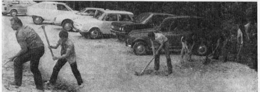
Zavihali smo rokave

V torek, 8. 9. 1981, smo se zbrali na Čočovju, ter se odpeljali na »delovišče«. Tovariš nadzornik nas je že pričakoval in lopate, krampe, grablje... smo hitro razgrabili in pljunili v roke. Razdelili smo se po trasi: ena skupina je urejala okolico, druga kopala jarek, tretja skupina pa kopala za plavalni bazen za otroke (ali neplavalce — saj bo globok le 1,30 m). Naj omenim še to, da »lenuhov« med nami ni bilo, zato smo tudi v dveh urah in pol »nekaj le naredili«. Ni nas bilo treba priganjati, saj smo se zavedali, da je na Ivarčkem jezeru potrebno še veliko dela, da bo naš center končno zgrajen.