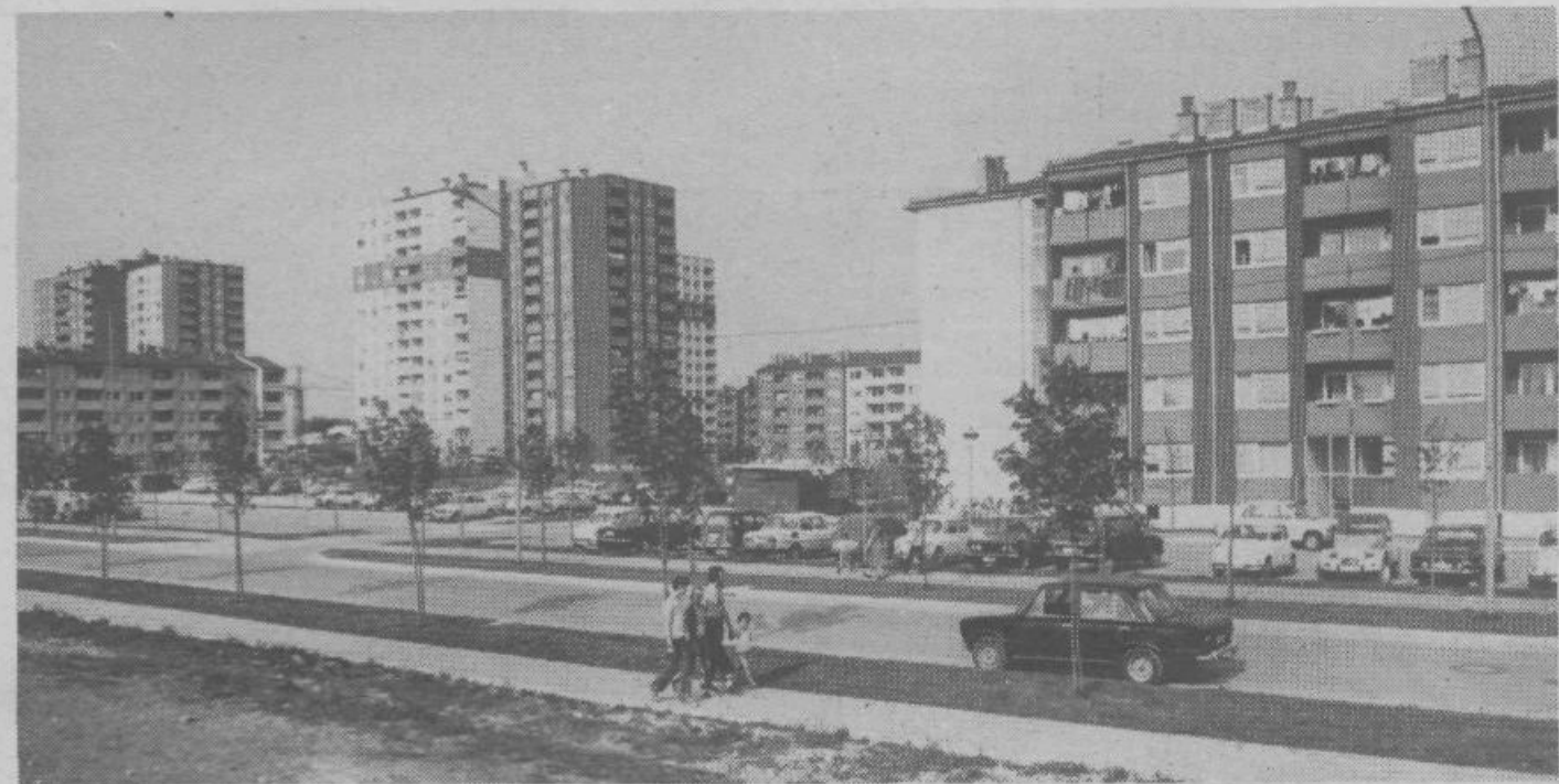
Nova razglednica Ljubljane! Zažvelo je novo Štepanjsko naselje v občini Moste-Polje. Tu bo dobilo svoj dom preko 3.000 družin. Poleg trgovin bo ob Litijski cesti tudi avtoservisni objekt in bencinske črpalke. Vsa dela izvaja Imos.