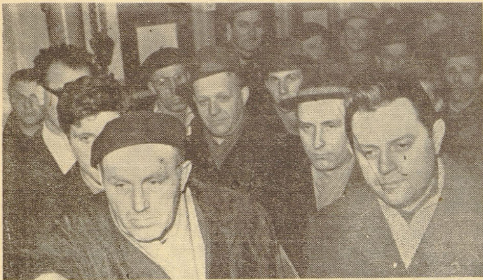
V »Elektromehaniki«, je bilo zaradi velikega števila zaposlenih (prek 4.000) 9 zborov delovnih ljudi. Slika kaže zborovanje v orodjarni