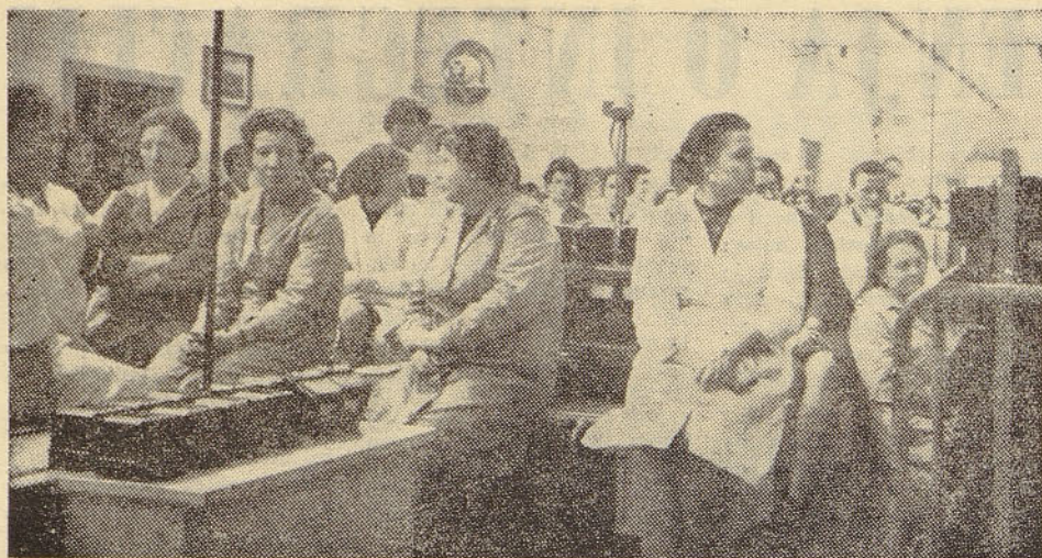
V soboto, 14. aprila je imela »Elektromehanika« v vseh enotah zbere delovnih ljudi, kjer so bili navzoči podrobno seznanjeni o ekonomski nujnosti integracije ISKRA-RIZ. Izredno zanimanje kaže, da bodo člani »Elektromehanike« v večini glasovali za pripojitev. Na sliki: Sestanka v obratu števec