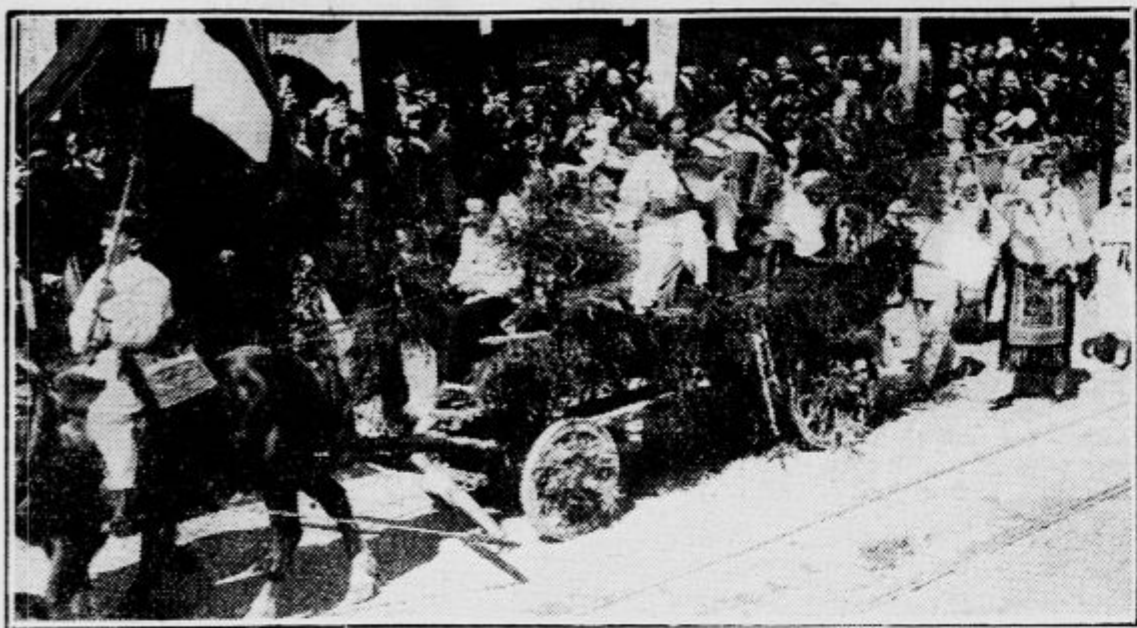
Vesela skupina Belokranjcev v narodnih nošah

Velikanska povorka je krenila izpred Mestnega doma ob 11.15 ter se je popolnoma razvila šele čez dobro uro. Povorka je otvorila imponentna vojaška parada.