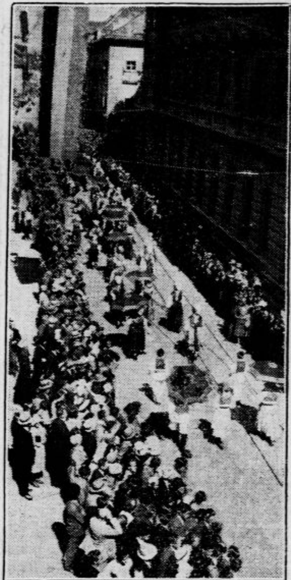
Narodne noše v sprevodu

je vsa v vencih in tudi nieno ozadje. Ši- roka Krisperjeva hiša, je preprečena s