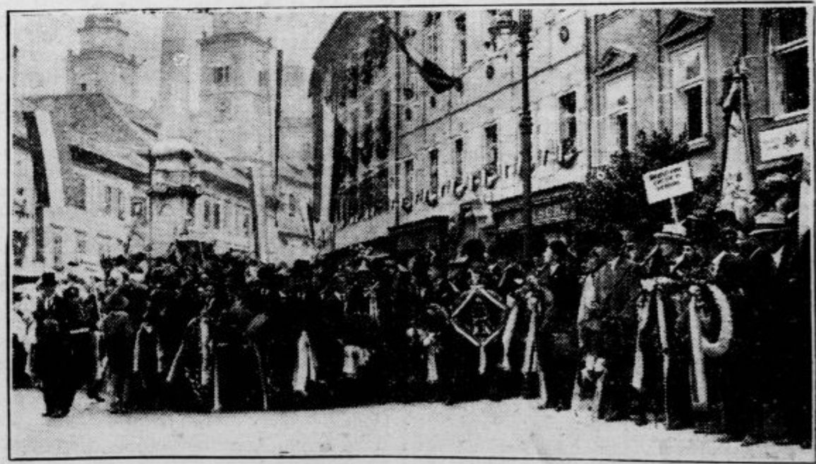
Polagatelji vancev, zbrani na levi strani slavnostnega prostora