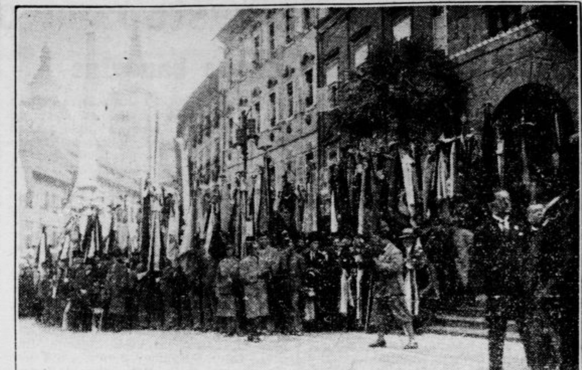
Slikovit gaj praporov na levi strani arkad

Za njimi so se uvrstila zopet številna akademska in prosvetna društva, Tabor, Zora, Istra, Zartja, Soča in druga. Za njimi so korakale zastopnice ženskih organizacij, nato članstvo JUU, pavska in glasbena društva, za katerimi so korakali postarni prekmurski fantje s svojo godbo. Za njimi se je vrstila CO Ljubljana in Prosvetna zveza s prapori, kateri so sledili 3 naši fantje korenjaki v gorenjski narodni noši, ki so otvorili velik sprevod narodnih noš. Prve so korakale gorenjske narodne noše z jeseniško godbo, največ zanimanja je vzbujal planšar iz Bohinja, za gorenjskimi je korakalo nekaj hrvaških narodnih noš, nato pa se je reprezentirala Belokrajina, katere sprevod so otvorili tamburaši na vozu, njim so sledili Belokranjci v svojih pestrih narodnih nošah. Naši Krakovčani in Trnovčani so se tudi imenito postavili s svojimi narodnimi nošami na okrašenem kmečkem