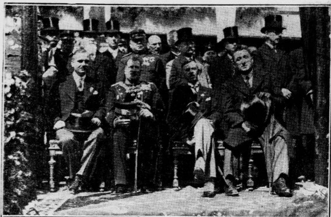
Najvišji dostojanstveniki na tribuni

Najmogočnejše slavje, kar jih je doživela bela Ljubljana — Slovesnost odkritja se je izvršila ob lepem vremenu in v vzornem redu — Impozanten sprevod po ljubljanskih ulicah