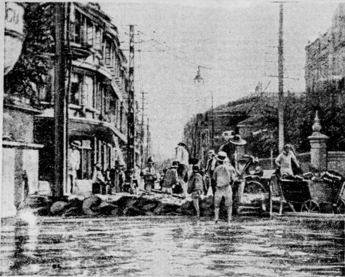
Po zadnjih poročilih iz nesrečne Kitajske se je reka Jangtse dvignila za 15 m nad svoj normalni vodostaj. Poleg 300.000 smrtnih žrtev je porušenih okoli 160.000 hiš. Slika kaže zasilne barikade v mestu Hankov.