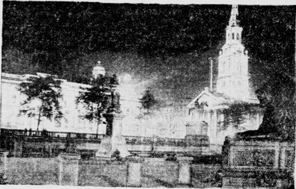
Ob priliki sedanjega kongresa za tehniko razsvetljave, ki se vrši te dni v Londonu, razsvetljujejo žarometi najvažnejša poslopja svetovnega mesta. Iluminacija je privabila na ulice cel milijon ljudi. Slika kaže del Trafalgar Square z Narodno galerijo in Martinovo cerkvijo.