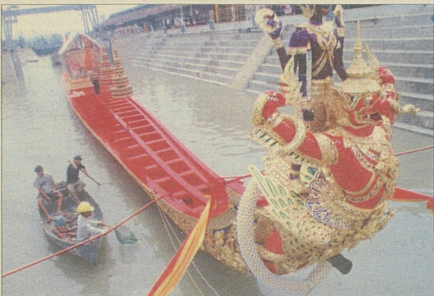
Ob priložnosti 50-letnice ustoličenja tajskega kralja Bhumibala Adulyadeja so mu darovali kraljevi čoln Narayana Song Suban, ki je sedaj pred častno tribuno v Bangkoku