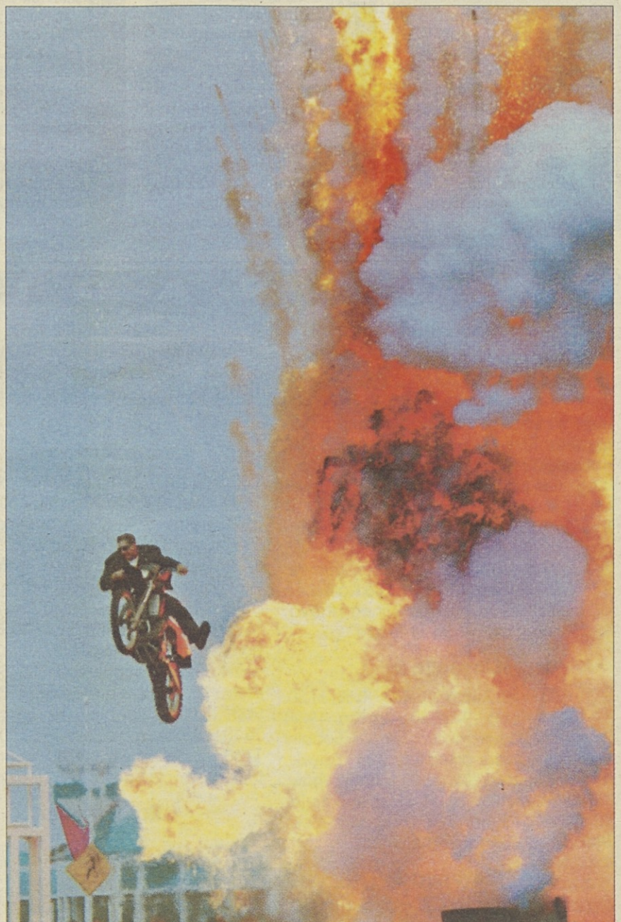
V filmu Terminator II, ki ga v teh dneh snemajo v ruskem Sankt-Peterburgu (Leningrad) je v najnevarnejših prizorih kaskader Jim Church zamenjal Arnolda Schwarzeneggerja