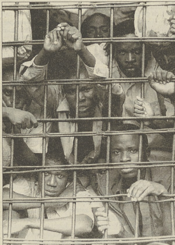
Ruandski zapori so polni osumljencev

domove, zažgali premoženje in pokradli pridelke. »Veliko ljudi, ki so si umazali roke z genocidom, je se vedno na odgovornih položajih v javnih službah in lokalnih oblasteh,« pravi poročilo Skupine za človekove pravice v Afriki. »Prezivelim in pričam je treba takoj zagotoviti zaščito in pomoč, tiste, ki se vedno izvajajo genocid, pa je treba poloviti in jih spraviti pred sodišče.« V ruandskih ječah se že zdaj gnete skoraj 70 tisoč hutujskih osumljencev, obtoženih sodelovanja pri množičnih pobojih.