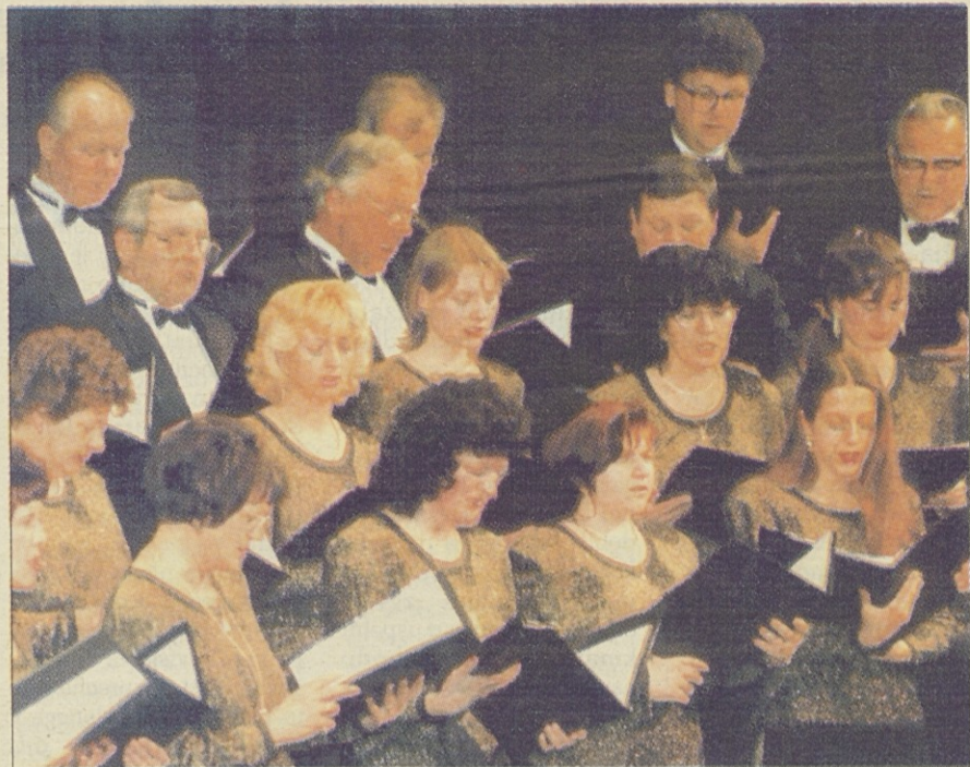
S tržaškega koncerta Primorske poje, ki je bil prejšnjo soboto zvečer v Kulturnem domu

Od prihodnjega petka do nedelje še zadnje štiri pevske prireditve