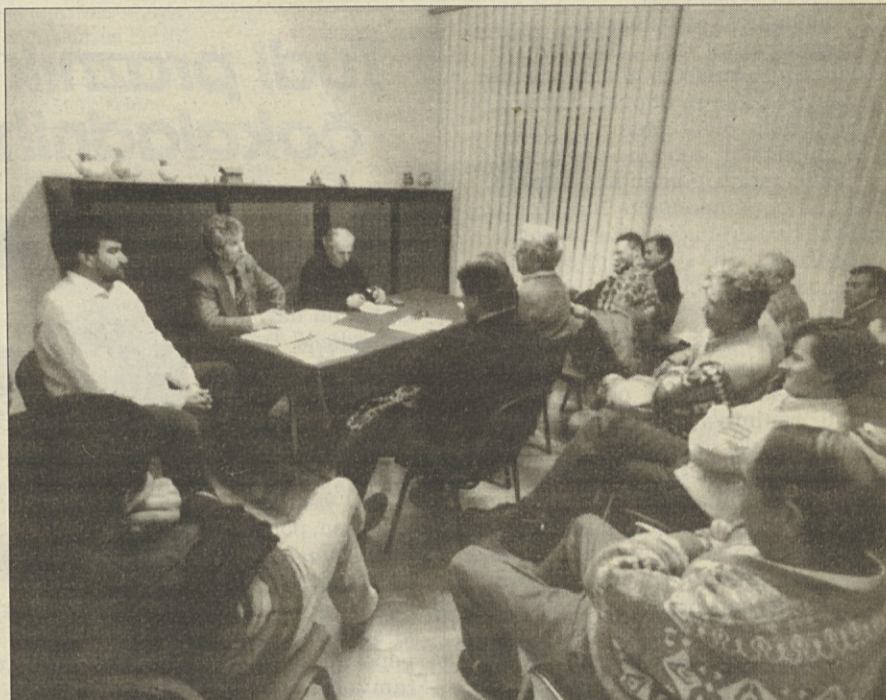
Četrtkovo zasedanje Glavnega sveta Kmečke zveze

Na koncu je Glavni svet zelo pozitivno ocenil tako poročila kot razpravo na občnem zboru. j.k.