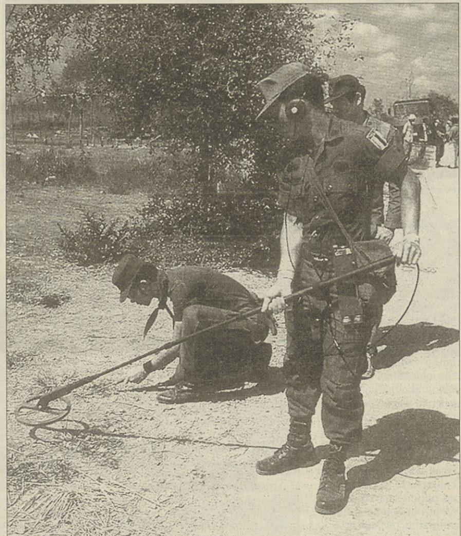
Odkrivanje min, ki ne poznajo konca sovražnosti, je hudo mukotrpno in nevarno delo

Številni upokojeni generali pa se zavzemajo za prepoved min in z njimi se povsem strinjam. Vlade lahko razglasijo mine za ilegalne, prav tako, kot so prepovedale kemično orožje. Seveda jih bodo barabe, kot sta Sadam Husein in Ratko Mladić, se vedno uporabljale, toda uporabnike - prav tako kot izdelovalce in trgovce - lahko odkrijejo in kaznujejo na mednarodnih sodiščih. Če bo do tega prišlo, bodo sle protipehotne mine po stopinjah kemičnega orožja. Na to bom seveda nazdravil, tako kot večina vojnih veteranov.