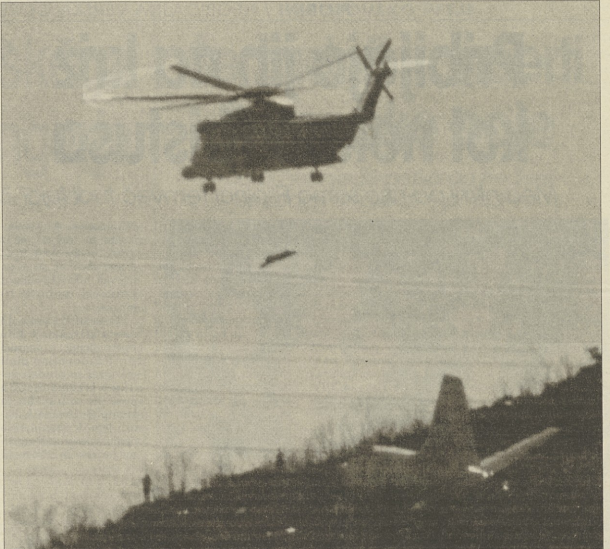
Ameriški vojaški helikopterji so ves dan odvažali posmrtno ostanke ponesrečencev