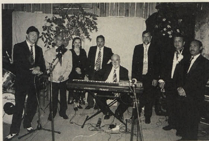
Ukrajinska romska skupina »Romini yag« na Stoparjevem skednju

sezonski delavci in kot državno priznani umetniki, glasbeniki in artisti bili pri kruhu. Sedaj pa je zaradi novih meja sezonska zaposlitev docela propadla, pa tudi umetniki in glasbeniki so prišli brezposelni. Kajti čas državne zaposlitve je mimo, ljudem pa primanjkuje denarja celo za najosnovnejše potreščine in ga za zabavo seveda nimajo odvečnega.