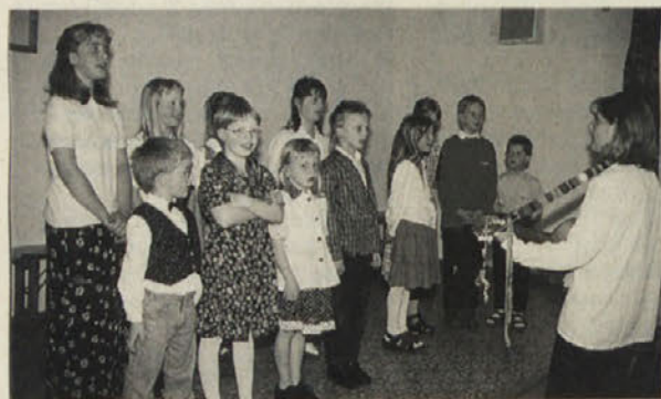
Otroci na Obirskem radi pojejo v društvu