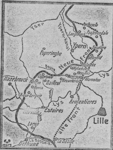
Hinter Armentieres und vor Ypern.

Prinašamo v pogled majhno slikico o zmagovitih uspehih nemške ofenzive proti Francozom in Angležem na zapadu. Stara