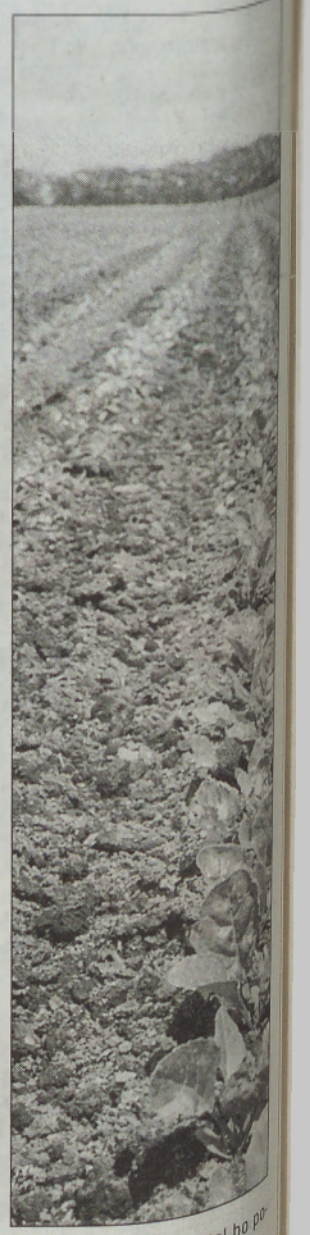
Zaradi zaskorjenosti tal bo potrebna ponovna setev.

je ponovna setev potrebna, je zavarovanec le-to dolžan opraviti takoj, ko so ugodne agrometeorološke razmere za setev. Kot smo že zapisali, določi zavarovalnica odstotek delnega izpada v količini končnega pridelka po posebni tabeli. Če je bilo soglasno dogovorjeno, da se setev ponovi, agrometeorološki dejavniki pa tega ne dopuščajo, se škoda obračuna, kot da bi bila setev opravljena v zadnjem roku po tabeli (16. maj). Če so bile agrometeorološke razmere ugodne in setev v dogovorjenem roku ni bila opravljena, zavarovanelec ni upravičen do zavarovalnine.