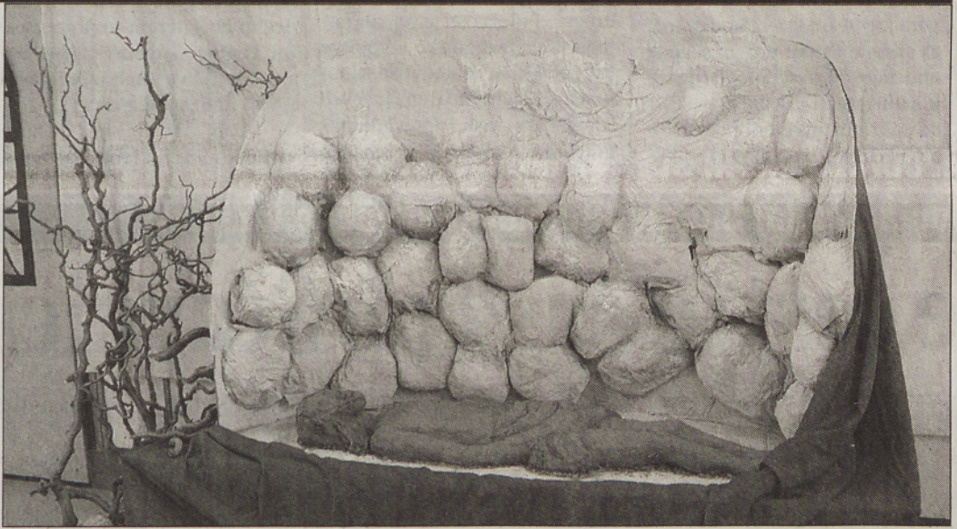
Kokotič je zapel na Svetih gorah: Mati Marija, gor stane! Judje so van sineka fkrali, so ga daleč odgnali, na Sveti Križ so ga pribili. Jemi je tekla sveta kri, a jngeli so jo gor poberali, so jo pred Kristusovo bridko manro nosili.