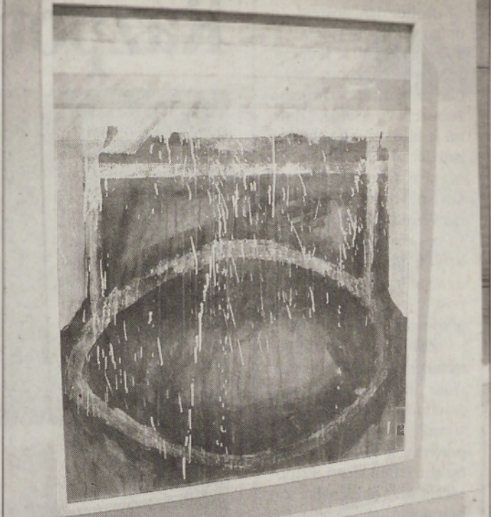
Po Ignacu Medenu bodo stene razstavnega prostora v PAC-u krasile slike Lojzeta Logarja. Otvoritev razstave njegovih del je bila namreč minuli petek zvečer, vendar se je avtor zaradi bolezni žal ni mogel udeležiti. Se je pa javil

po telefonu in vsem obiskovalcem zaželel dobro počutje in prijetno druženje.