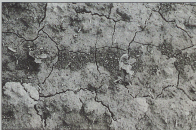
Dober vznik je odvisen od kakovostne priprave zemlje in setve.

so ponudili ugodne pogoje za dodatno zavarovanje vznika sladkorne pese. Visok in kakovosten pridelek sladkorne pese je namreč mogoče doseči le z dobrim poljskim vznikom in ohranjanjem ustreznega sklopa vse do spravila. Za dober poljski vznik sta potrebni poleg kakovostnega semena tudi pravilna predsetvena priprava tal in pravilna setev. Tudi ob zagotavljanju ustrezne agrotehnik pa se včasih žal zgodi, da je treba setev sladkorne pese zaradi slabega vznika ponoviti. Slab vznik je v največ primerih posledica zaskorjenosti zemlje, do katere pride zaradi dolgotrajnih padavin po setvi sladkorne pese. Ponovna setev prestavlja dodatne stroške za pridelovalce, zato so jim v Zavarovalnici Triglav ponudili dodatno zavarovanje tega rizika. Zavarovanje pokrije škodo, ki je posledica slabega vznika zaradi zaskorjenosti, toče, spomladanske pozebe, snežnih zametov ali poplave. Zavarovanje vznika sladkorne pese je dodatno in ga ni mogoče skleniti brez osnovnega zavarovanja za škodo po toči, požaru in streli. Cena dodatnega zavarovanja je enotna in znaša 3.700 tolarjev na hektar, sklene pa se lahko najpozneje do setve oz. do 10. aprila. Zavarovalnica poravnava oškodovancem stroške ponovne setve, ki se priznavajo v letu 2002 v višini 40.000 tolarjev na hektar,