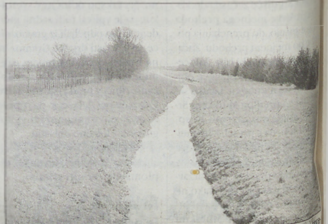
Hkrati z gradnjo avtoceste naj bi bila Ledava deležna temeljite regulacije in celotne delne selitve.