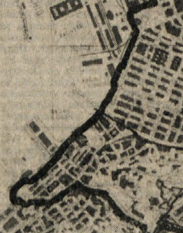
Središče mesta, kjer ne bo več kaotične trgovinske mreže