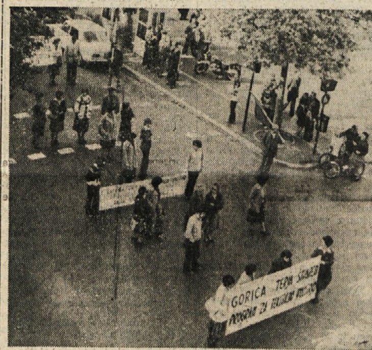
Prizor z včerajšnje delavske manifestacije

Po sprevedu je bil shod na Travniku - Udeležili so se ga tudi dijaki in zastopniki občin