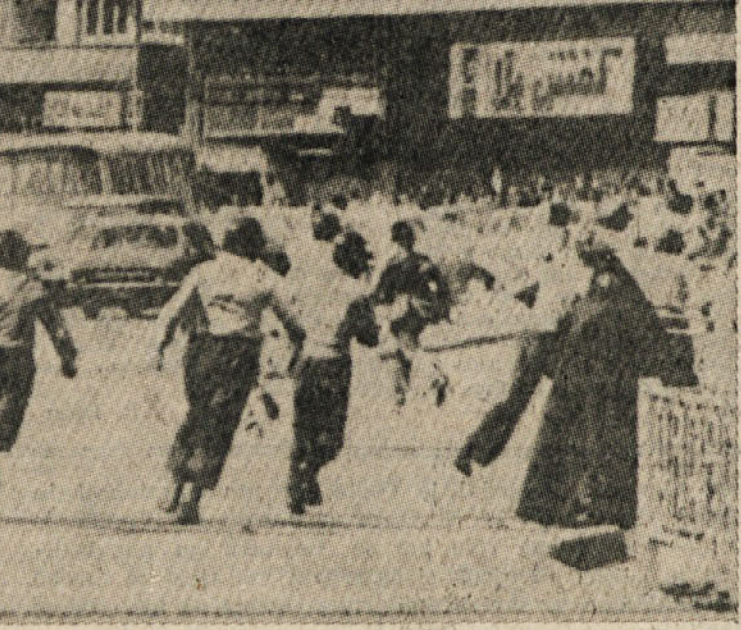
Med študentovsko demonstracijo po teheranskih ulicah