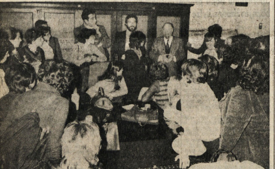
Šolski skrbnik v razgovoru s starši, ki so zasedli prostore

Vsa slovesnost bo v prostorih restavracije Volnik v Repnu jutri, 5. novembra 1978, z začetkom ob 10. uri. Po slovesnosti so vsi udeleženci vabljeni na družabno kosilo.