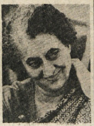
INDIRA GANDHI — Nov poskus uveljavitve na političnem prizorišču

Vladajoči džanati so v hihu pozabili na stara trenja. Celotno volno notranje opozicije Caran Sing, ki ga je Desai sredi leta izkličel iz kabineta, je podprl Virendro Patila. V pričakovanju izida volitev petega novembra so odločili tudi doigo napovedano prerazdelitev resorjev v kabinetu premiera Desai in imenovanje novih osebnosti na šest praznih položajev.