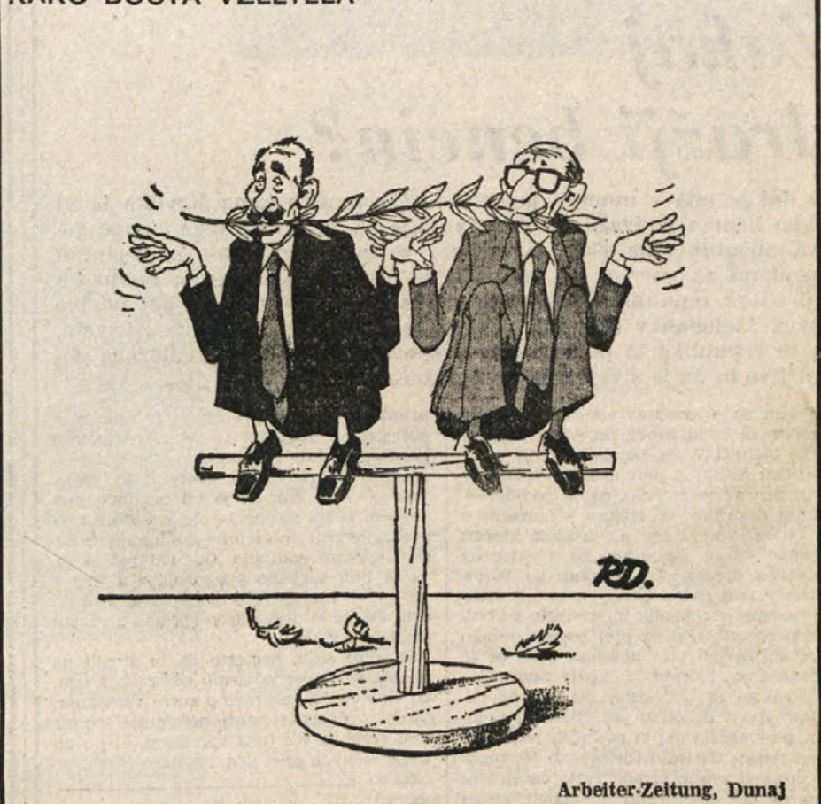
DRAGAN MILOSAVLJEVIĆ Arbeiter-Zeitung, Dunaj