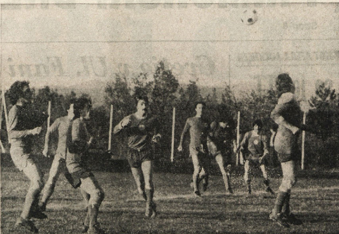
Primorec in Breg (na sliki) sta se pred tednom dni srečala med seboj, jutri pa bosta akterja še dveh domačih derbijev: Trebenci bodo igrali z bazoviško Zarjo, Brežani pa s prosekim Primorjem