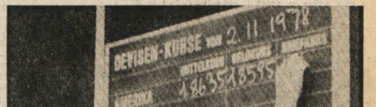
Po najnovejših Carterjevih ukrepih v podporo dolarju se vrednost ameriške valute neprestano dviga: včeraj je npr. dolar veljal že kar 830 italijanskih lir. Na sliki prizor s frankfurtske borze

Washington razširila vest, po kateri sta delegaciji obšli osrednjo zapleteno pogajanje s kompromisom. Ta zapreka je ticala, kakor znemo, v egipčovski zahtevi, da se mirovnemu sporazumu pripiše klavzula o navezavi pogodbe na reševanje celovite bližnjezhodne problematike (to se pravi palestinskega vprašanja). No, izraelsko in egipčovski odposlanstvo se sta domenila, da se odredita tvorsti »preambula« in zavedne pogleda na to, kaj bi bilo pravih razjasnitelj v ločenih spomenicah, ki naj se vključita v pogodbeni paket.