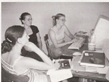
Poleg kuhanja je potrebno recepte in nasvete vestno zabeležiti