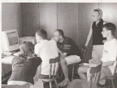
Analiza pridobljenih rezultatov o javnem mnenju.