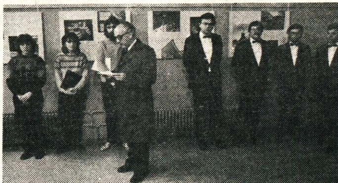
Trenutek z otvoritve razstave, ki jo jypripravil FKK Mavrica iz Radomelj v Domžalah pod naslovom: „Domžale v našem objektivu“