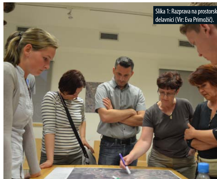
Slika 1: Razprava na prostorski delavnici.

Z rezultati projekta smo zadovoljni, najbolj pomembno pa je, da so z njimi zadovoljni tudi prebivalci Šentruperta. Želimo si, da bi do implementacije projekta prišlo kmalu in bi tako nova pot zaživela v prostoru.