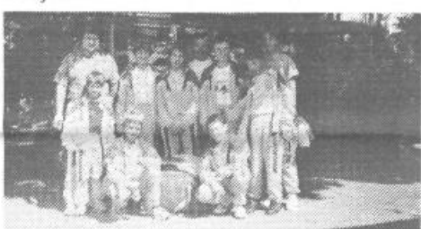
Mlada namiznoteniška ekipa ŠD Podpeč-Preserje