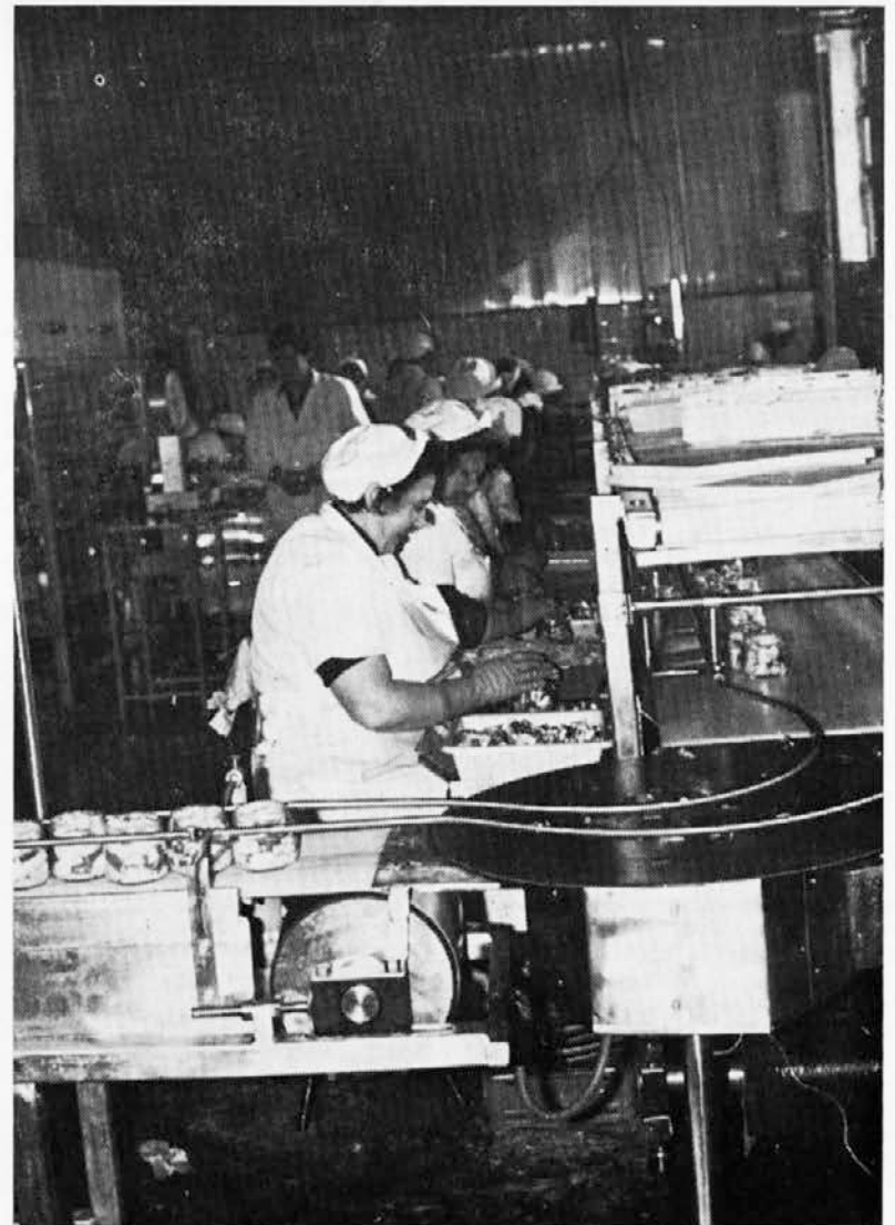
TOZD »Delamaris« — v oddelku marinad so začeli z redno proizvodnjo