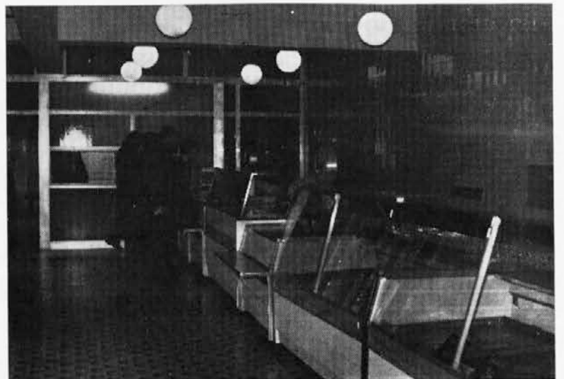
Takoj po otvoritvi obnovljene ribarnice 18. 11. 1981, smo naredili nekaj posnetkov