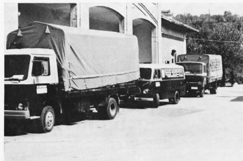
Del voznega parka TOZD Blagovni promet

končen»? Hiter zato, da je blago, ki ga uporabnik naroči pri njem tedaj, ko ga potrebuje, ob pravem času in »dokončen«, da ne glede na vrst prometa ali panoge prometa (morje, zrak, železnica, cesta) dobi uporabnik blago na mesto uporabe. Glede na takšno postavko morajo biti načrtovalci prometnih sredstev seznanjeni z vsemi podrobnostmi o potekanju proizvodnje blaga in distribucije, o lastnostih blaga itd., da bi lahko načrtovali prometna transportna sredstva in prevozne poti.