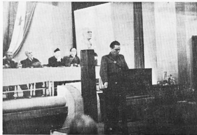
Na drugem zasedanju AVNOJ je Vrhovni komandant NOV in POJ Josip BROZ-TITO podal referat »Razvoj osvobodilne borbe narodov Jugoslavije v zvezi z mednarodnimi dogodki

Izkušnje iz bojev v vseh krajih države so pokazale, da je potrebno vstajo organizirati v sirino in da je potrebno izboljševati tudi kvaliteto oboroženih sil. Zato je bilo nujno formirati