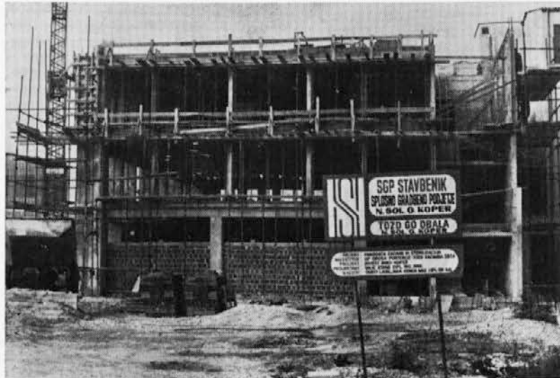
DOGRADITEV OBRATOV TOZD »Začimba« — pakirnica začimb in sterilizacija

S stališča varstva okolja zagotavlja nameravana investicija tudi manjše onesnaževanje okolja zaradi predvidene priključitve fekalne kanalizacije TOZD »Začimba« na centralni kanalizacijski sistem Portorož — Piran, s čimer ne bomo več onesnaževali Jernejevega kanala.