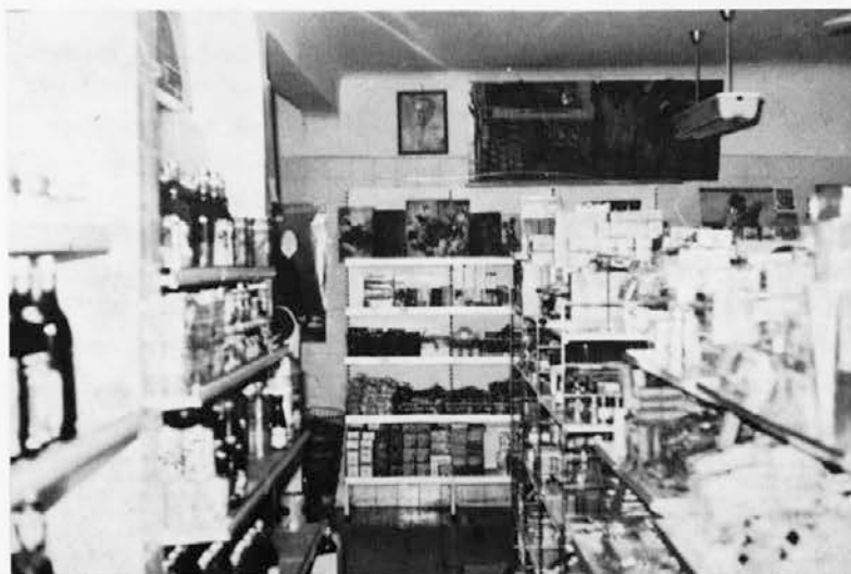
LEPO JE DELATI V TRGOVINI, če ni praznikov v bližini