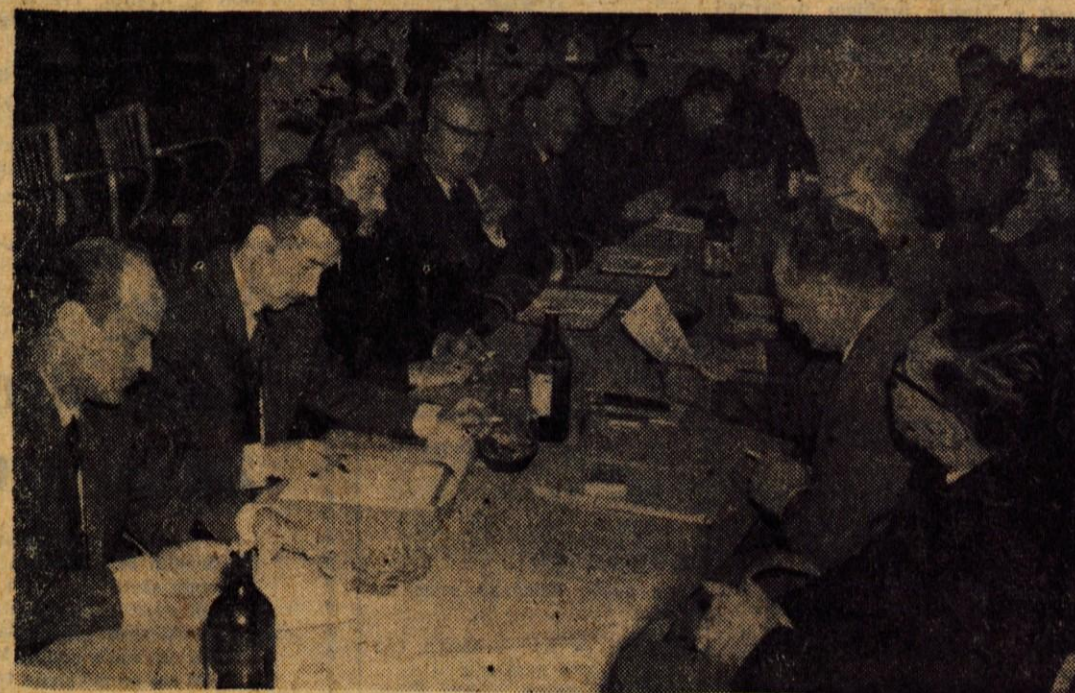
S posvetovanja o gorenjskih muzejih