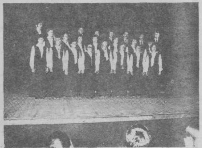
Mešani pevski zbor DKD Svoboda Zalog ob prvem nastopu v novem kulturnem domu Španski borci.