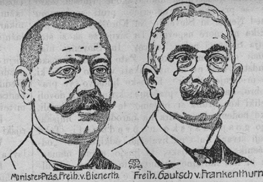
Minister Präs. Freih. v. Bienenrth. Freih. Gautsch v. Frankenthurn

Na drugem mestu smo že omenili, da je dosedanji naš ministerski predsednik baron Bienenrth odstopil. Za vodjo naše vlade bil je zdaj Gautsch pl. Frankenthurn imenovan. Naša slika kaže odstopeniškega in pa novega ministerskega predsednika.