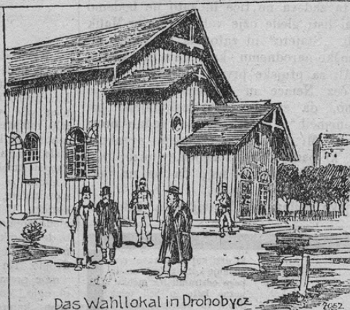
Das Wahllokal in Drohobycz