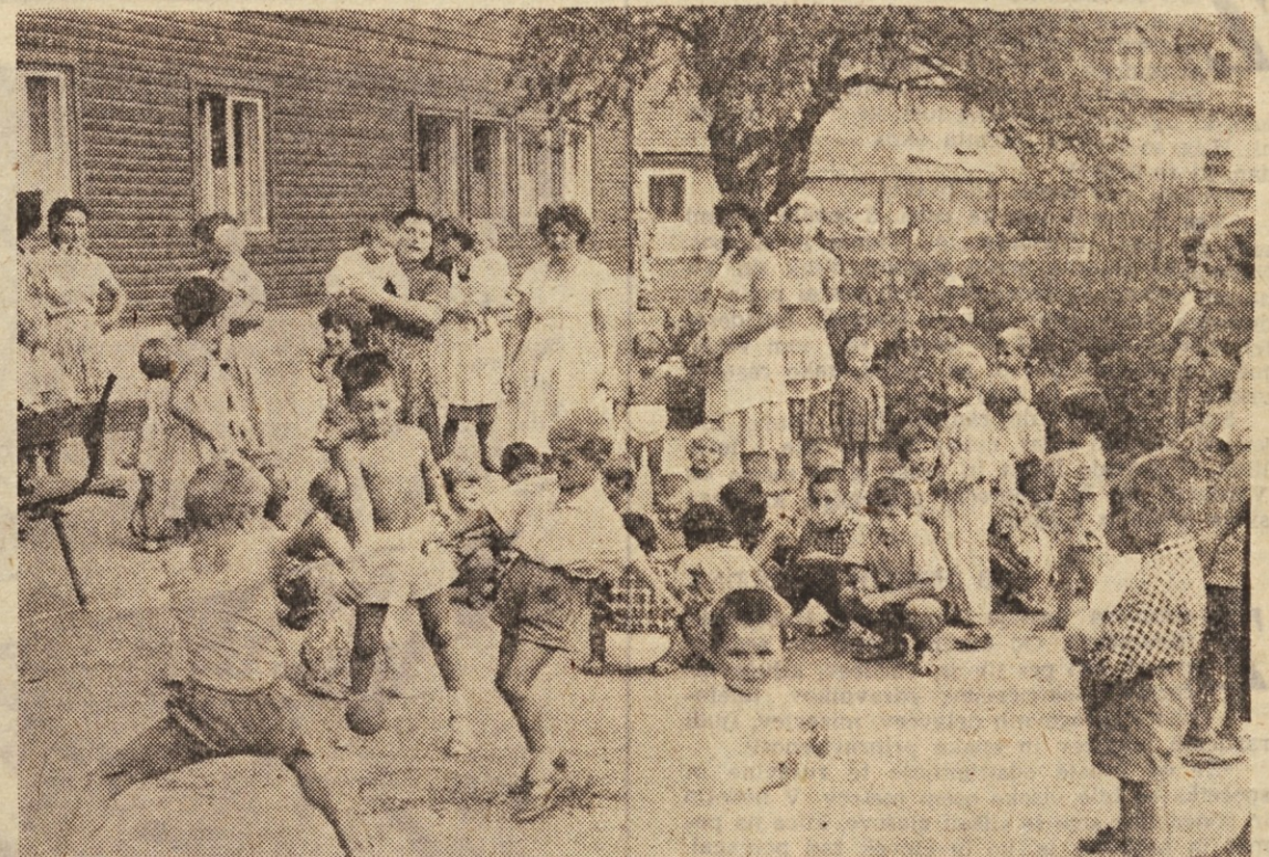
Okoli 2700 makedonskih otrok in mater je našlo v Sloveniji začasni dom. Ob tovarištvu in gostilnosti gostiteljev počasi pozabljajo na dneve g roze