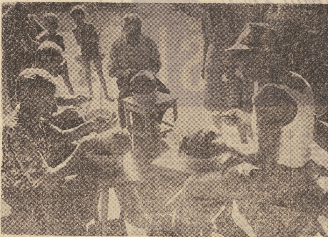
Seiška dolina je še pred leti slovela ne samo po klekaričah, temveč tudi po — klekarijih. Sedaj pa ta domača obrt izumira. Mladina se, razumljivo, raje zaposluje v industriji in zato je takle prizor skorajda že redkost Seiške doline. Turistično društvo v Zeleznikih pa hoče pospeševati to domačo obrtno dejavnost in zato je sklenilo organizirati zadnjo nedeljo v avgustu — prvi čipkarski dan na Gorenjskem.

O težah bodo v kolektivu razpravljali približno do decembra meseca. Zato, da bi razprava potekala čimbolj organizirano in da bi res vsak udeleženec povedal svoje mnenje o posemeznem problemu, mislijo sestavljavci predlagati v razpravo postopoma posamezna poglavja bodočega statuta. Po tej organizirani in vsestranski razpravi se bodo lotili izdelave osnutka statuta, ki bo seveda znova v razpravi. -r