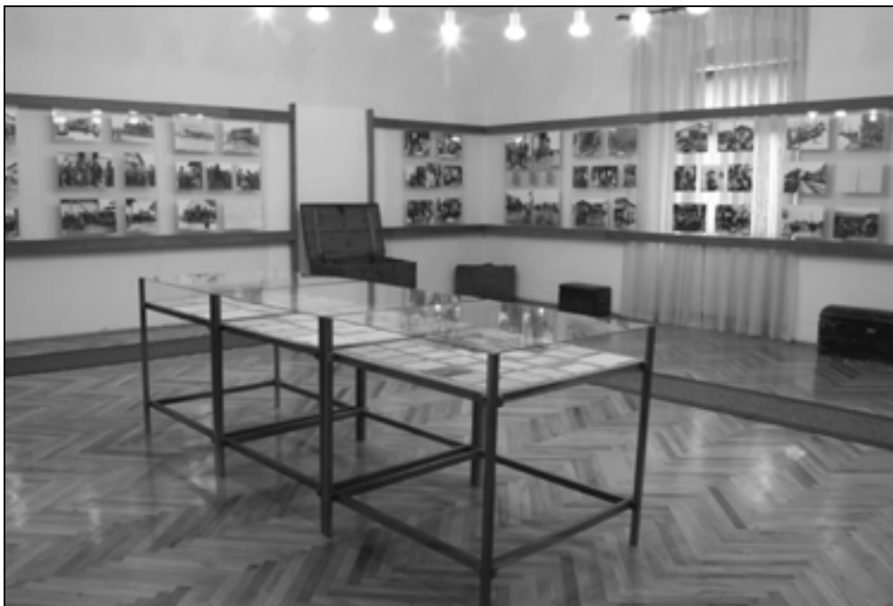
Razstava o slovenskih izgnancih.

Razstava o slovenskih izgnancih je predstavljala okupatorjeve težnje po slovenskem nacionalnem ozemlju pred vojno, razkosanje Slovenije in nemške raznarodovalne ukrepe, vse s ciljem ponemčenja slovenskega prebivalstva na nemškem zasedbenem ozemlju v roku največ pet let, in s tem uničenje slovenskega naroda kot etnične enote. Za doseg te ciljev so poleg raznarodovalnih ukrepov in ponemčenja načrtovali tudi izgon Slovencev. V njih so določili, da želijo izgnati med 220.000 in 260.000 Slovencev ali vsakega tretjega Slovenca, živečega na območju nemške zasedbe. V načrtih so določili, da bodo izgnali vse slovenske izobražence, vse prišleke na Gorenjsko in Štajersko po letu 1914, s čimer so bili mišljeni predvsem primorski Slovenci, z namenom naselitve Nemcev, predvsem s Kočevske, nadalje vse prebivalstvo obsavsko-obsoteljskega pasu ob novi meji nemškega rajha z Italijo, in v četrtem valu rasno neprimerne Slovence. Na razstavi so bila predstavljena preselitvena taborišča za izgon Slovencev, izgon v Srbijo, Hrvaško in Nemčijo, v Nemčiji pa taborišča Volksdeutsche Mittelstelle oziroma delovna taborišča. Predstavljeno je bilo tudi naseljevanje Nemcev na izselitveno območje tretjega