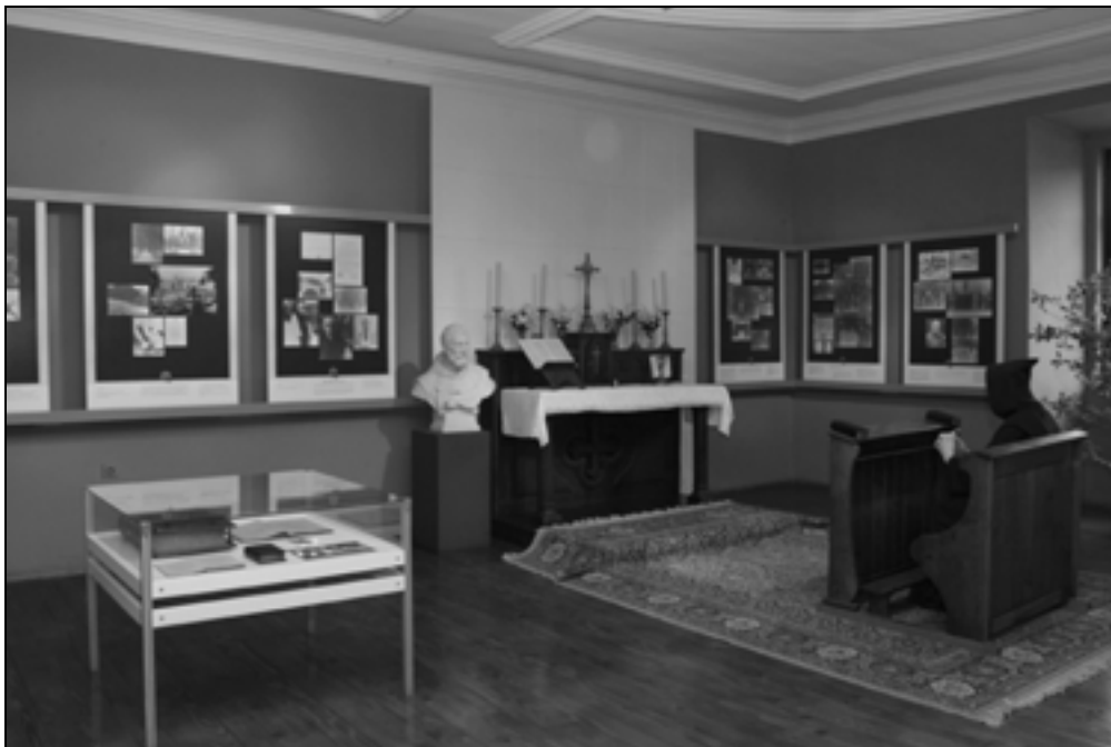
Razstava Trapisti v Rajhenburgu.

kraju Brestanica po letu 1952. V sklopu prireditev ob 1100-letnici je bilo na gradu več razstav in prireditev, najodmevnejša je bila lovska razstava.