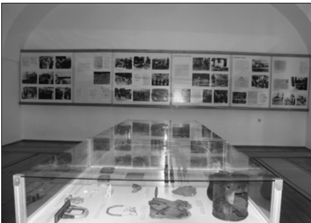
Razstava politični zaporniki in interniranci.

rance in izgnance pri Republiškem odboru ZZB NOV Slovenije ter Komisija predsedstva CK ZKS za preučevanje zgodovine ZKS. 4