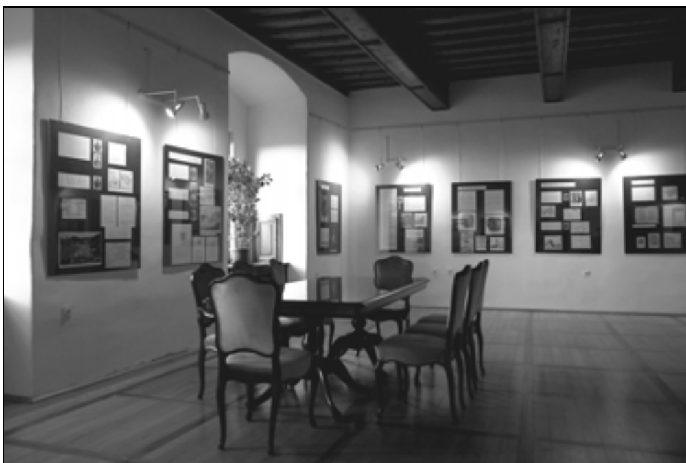
Renesančna dvorana, razstava Brestanica skozi čas.

Muzej političnih zapornikov, internirancev in izgnancev Brestanica se je leta 2001 preimenoval v Muzej novejšje zgodovine Slovenije, Enota Brestanica. Dne 26. julija 2001 je Vlada Republike Slovenije sprejela sklep o ustanovitvi javnega zavoda Muzej novejšje zgodovine Slovenije. V ustanovitvenem aktu je zapisano, da v sestavi muzeja deluje dislocirana organizacijska enota v Brestanici. 9 Tudi v ustanovitvenem aktu javnega zavoda Muzej novejšje zgodovine Slovenije z dne 22. januarja 2009 je navedeno, da ima zavod dislocirano organizacijsko enoto v Brestanici. 10