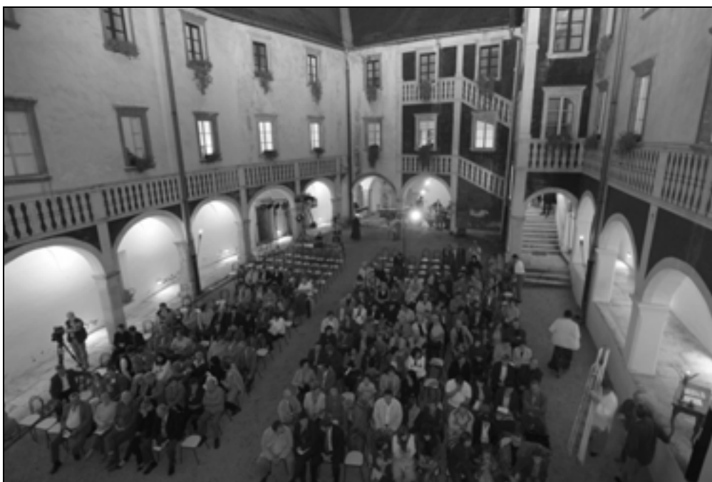
Prireditve Špičasta sprava, 30. september 2006 (foto: Goran Rovnan).