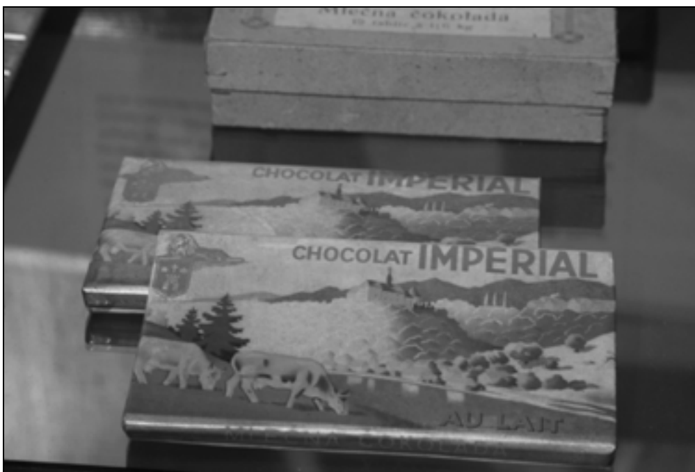
Detajl z razstave.