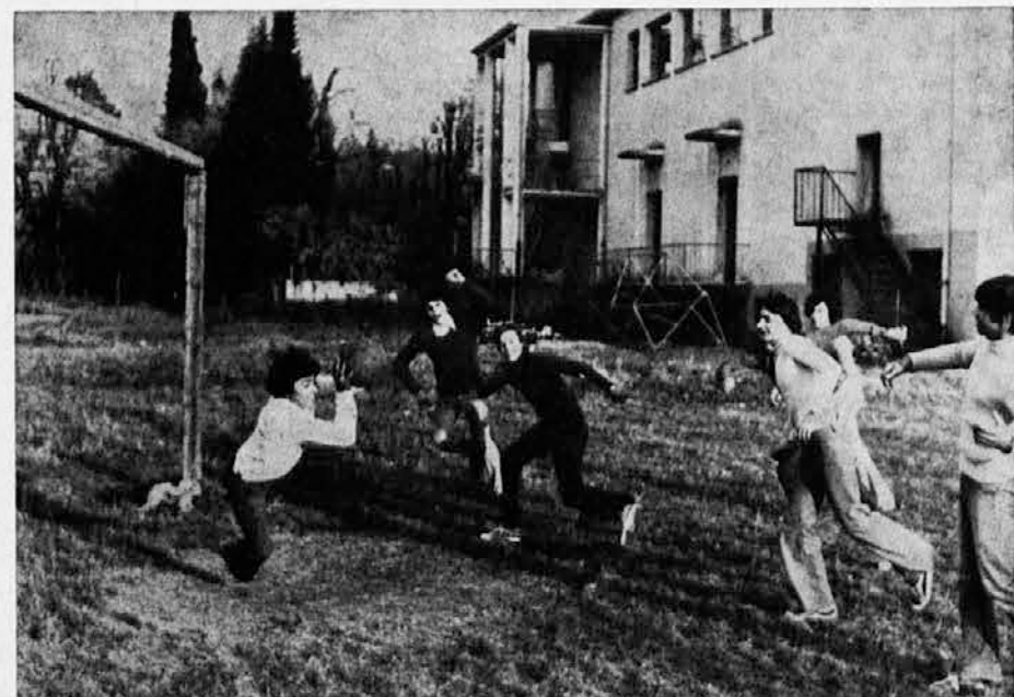
Ob Katoliškem domu v Gorici je tudi prostorno igrišče, katerega naša mladina pridno in vsestransko uporablja. Tudi ta slika priča o tem razgibanem delovanju

iz Ljubljane. Na sporedu so kantate Bohuslava Martinuja, Stanka Premrla in Matije Tomca.