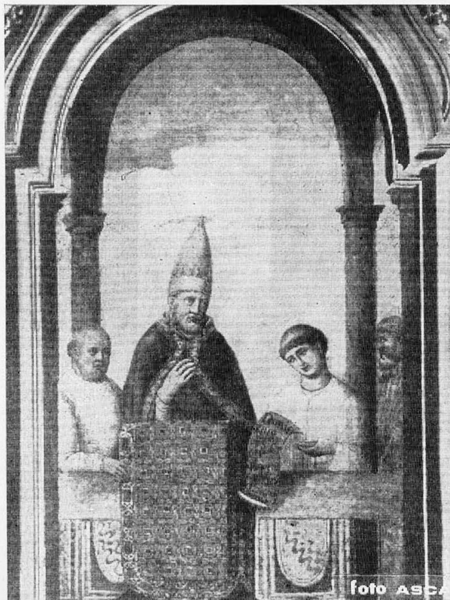
Papež Bonifacij VIII. odpira sveto leto 1300 (freska v lateranski baziliki v Rimu, ki jo pripisujejo Giottu)