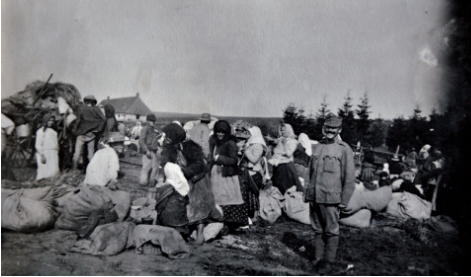
Gališki begunci na poti v neznano, jeseni 1914.

val beguncev 5 z zasedenega ozemlja, na katerem je do takrat živelo okoli 4,8 milijona ljudi. Med begunci so po narodnosti prevladovali Poljaki in Rusini (Ukrajinci), poleg njih pa še nekaj deset tisoč Židov in Nemcev. Po veroizpovedi so bili rimo-katoliki in uniati. 6 Tisti, ki so živeli bližje frontnim linijam, so odšli prvi, še pristo- voljno, da si rešijo vsaj življenja, preostali so morali domove zapustiti na ukaz državnih oblasti. Po navadi so ti ukazi prišli iznenada in beguncem niso dopuščali, da bi v naglici vzeli s seboj kaj več kot le najnujnejše. Država jim je omogočila brezplačen prevoz z vlaki in jim iskala nadomestna bivališča v notranjosti monar- hije. Bolje situirani in izobraženi so se znašli po svoje in si sami poiskali streho nad glavo tam, kjer so želeli, največkrat pri sorodnikih ali prijateljih, za ostale je bila to pot v neznano, ki jih je v večini primerov pripeljala v begunska taborišča na Češkem, v današnji Avstriji ter le v manjšem številu k družinam v notranjosti monarhije.