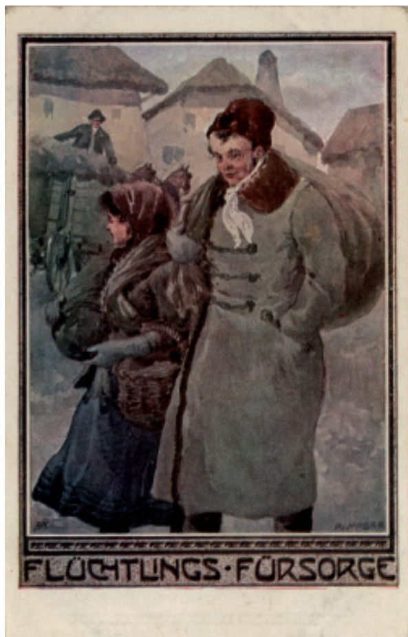
Razglednica, izdana z namenom pomagati beguncem.

Kranjska je prve begunce sprejela v začetku septembra 1914, po padcu Lvova. O njih je 10. septembra prvi poročal dnevnik Slovenec. 9 Do začetka oktobra je prišlo že okoli 2 600 in do januarja 1915 več kot 5 000 oseb. Največ jih je prišlo od septembra do novembra, med njimi tudi nekateri, ki so sprva bivali na Češkem. O njih je tednik Gorenjec 20. novembra 1914 zapisal: »Celo poletje so delali kot kmečki delavci na Češkem in sedaj na zimo so jih Čehi privoščili Slovencem.« Pripotovali so z vlaki, posamično ali v transportih, ki so šteli po več sto oseb. Ljubljana je bila le vmesna postaja na njihovi poti, tu je ostalo le nekaj izobražencev, ostale je mestni magistrat že po nekaj dneh napotil v druge občine na Kranjskem, med njimi tudi v občine Škofja Loka, Stara Loka, Selca, Železniki, Žiri in Sora.