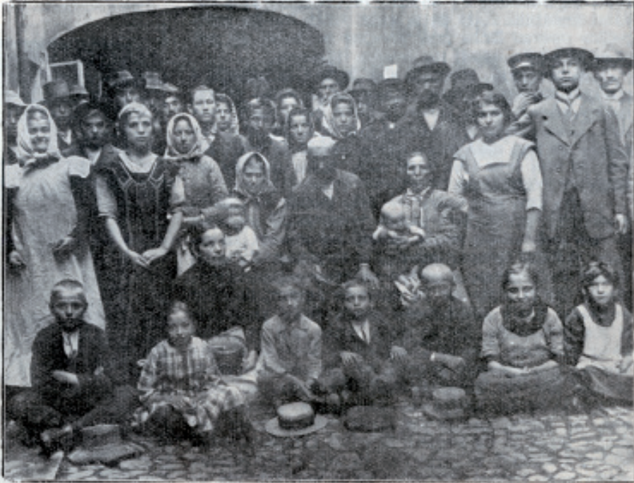
Gališki begunci v Ljubljani, oktober 1914. (iz: Tedenske slike , št. 9, 7. 10. 1914, str. 7)