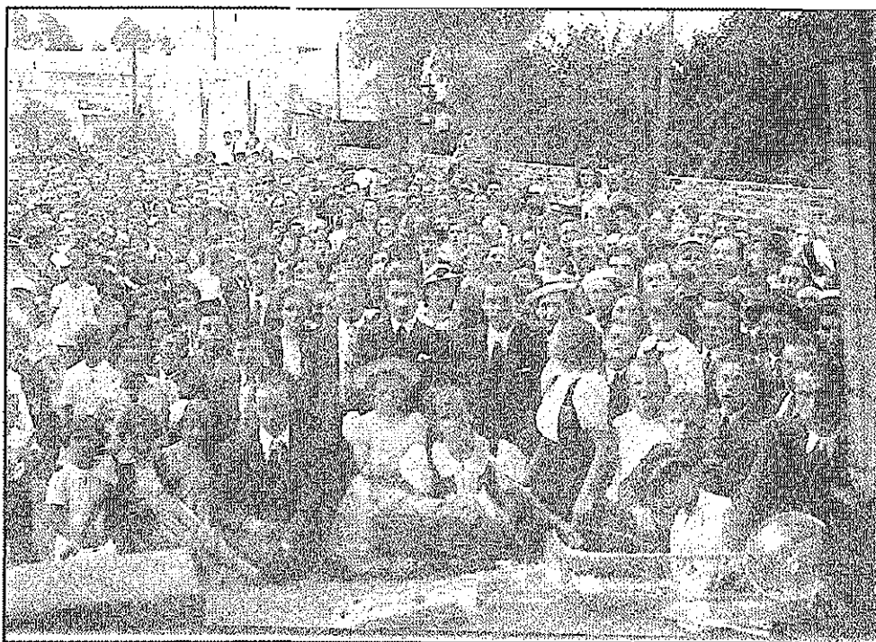
Slovesnost ob odprtju doma Delavskega kulturnega društva Ljudski oder v Buenos Airesu leta 1938 (NŠK). Ceremonia de inauguración de la sede de la Asociación Cultural Obrera Eslovana Escenario popular, Buenos Aires, 1938.

rojaki v Argentini osnovali dve društvi: leta 1940 je bila ustanovljena Slovenska krajina, leta 1943 pa Vzajemno društvo Slovenec (ES 4, 1990, 223). 13 Rojaki s Kranjskega pa so leta 1937 ustanovili društvo Samopomoč Slovencev. Njihova organizacija je bila splošno znana z imenom Kranjsko društvo (Mislej, 1983, 146).