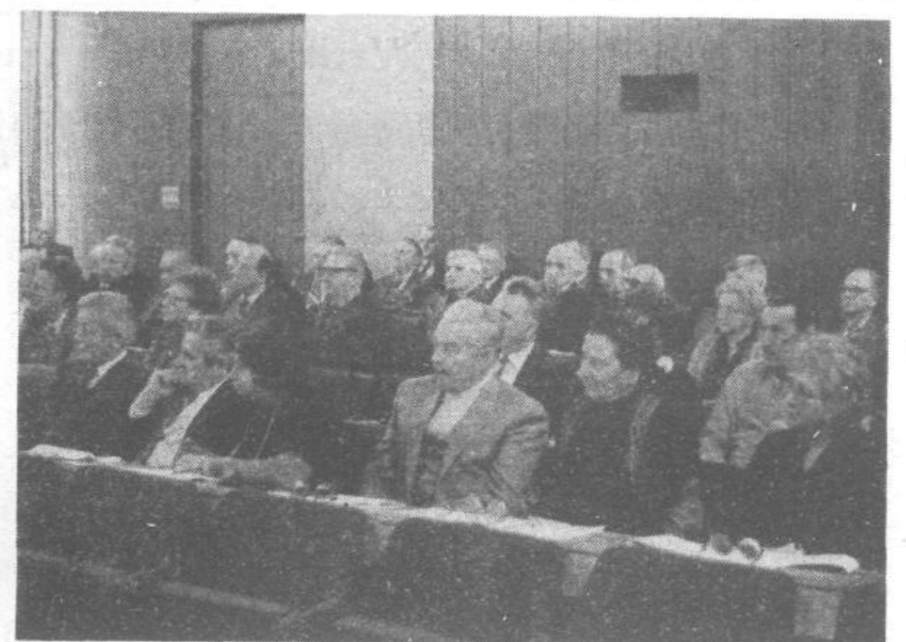
Nismo proti sodobnim pesmim, smo pa proti izmalicženju originalnih partizanskih pesmi, ki s svojimi melodijami in teksti izpričujejo socialistično domoljublje, nacionalno zavest.

V široki in kritični razpravi na poročilo dela organov in komisij, so borci izpostavili številna aktualna vprašanja. Antisocialistična gibanja doma in v tujini, so poudarili, blajto našo stvarnost, našo preteklost, našo ustavno ureditev, pridobitve revolucije.