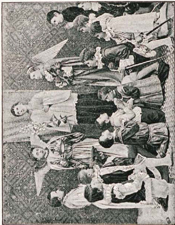
Sv. Alojzij v nebeški slavi. (Po fotografiji žive slike Marijaniških gojencev.)