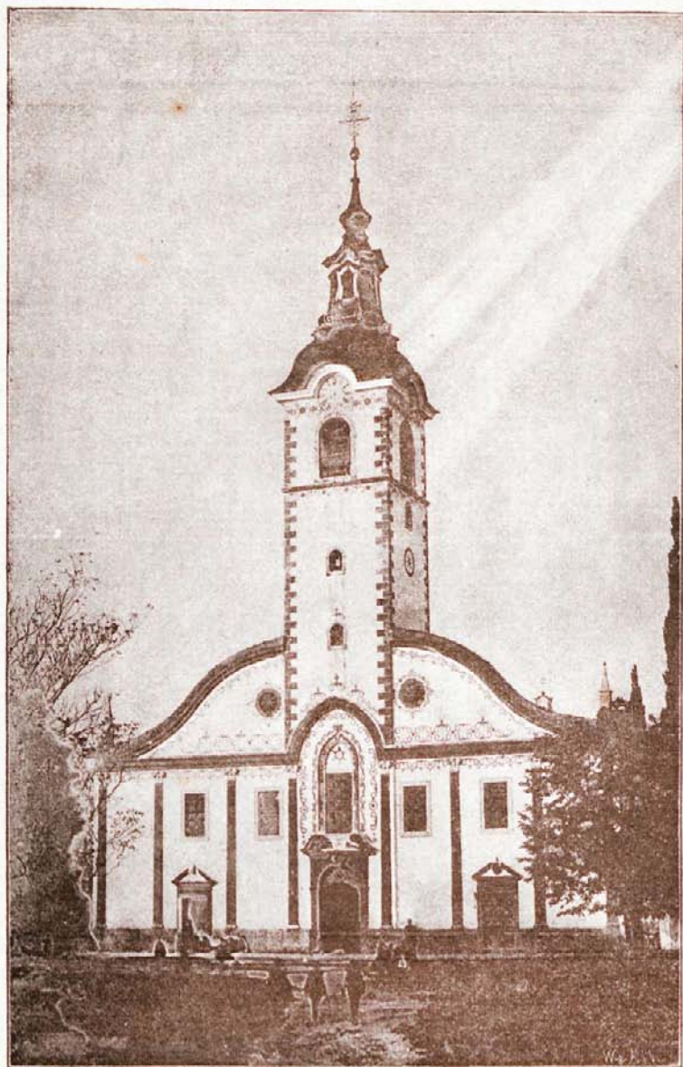
Romarska cerkev na Trsatu.