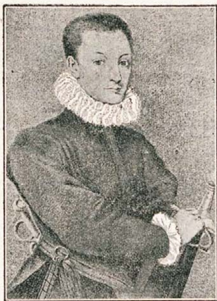
Sv. Alojzij, star 17 let.