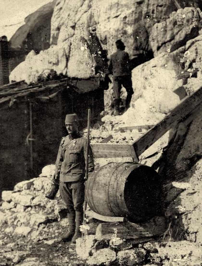
Bošnjaški vojak ob sodu, v katerega se zbira voda iz talečega se snega.

"To je zahrbtna dežela, verjemite mi, gospod Kugy. Storite mi to uslugo. Ne bo vam žal, plača, ki jo lahko ponudim, je polkovniška."