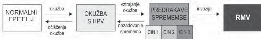
Slika 1. Tri stopnje razvoja RMV. Akutna okužba s HPV, vztrajanje okužbe ter razvoj predrakavih sprememb in invazija, ki je značilna za RMV.

ženskah; pri ženskah med 18. in 34. letom nazaduje okoli 84 % predrakavih sprememb, pri ženskah, starih 35 let in več, pa okoli 40 % (1).