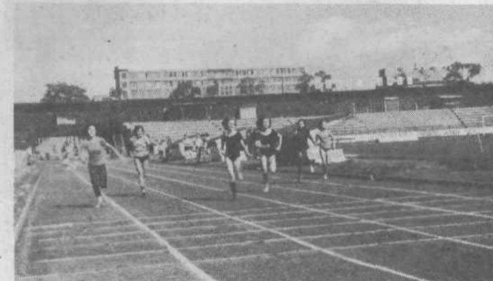
Atletika je prva prednostna športna panoga v republiki, zato so v lanskem šolskem letu organizirali celo vrsto raznih atletskih tekmovanj. Posnetek je z ljubljanskega centralnega stadiona, kjer je bilo tudi atletsko prvenstvo občine Ljubljana Center za osnovne šole. Posnetek je s teka pionirk na 100 metrov.