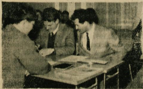
Na mladinski konferenci je bilo delovno vzdušje