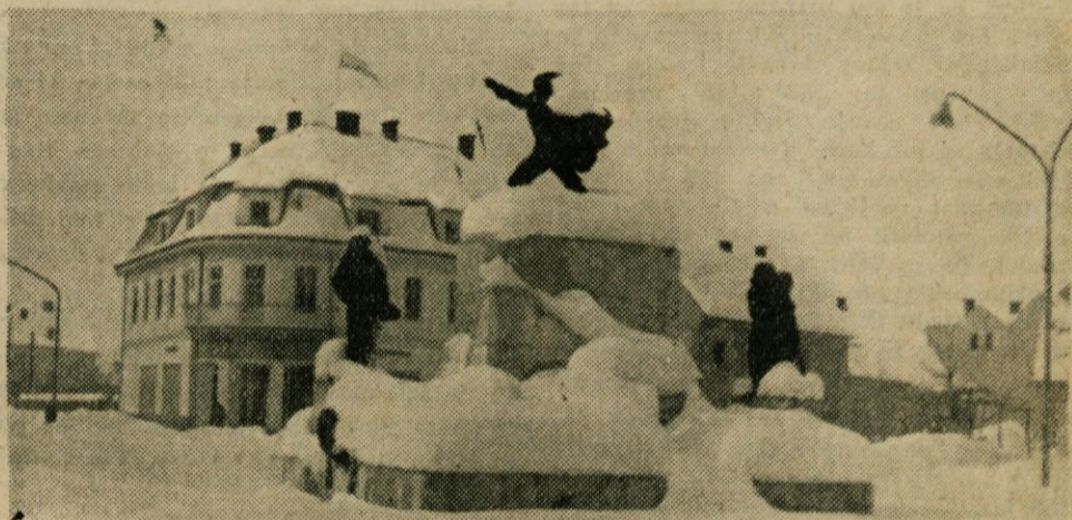
Visok sneg je zapadel središče Domžal, upravo komunalnih podjetij pa postavil pred težavno nalogo. Ali ji je bila kos?

V industriji so že gospodarske organizacije same predlagale povečanje obsega svoje proizvodnje, vendar pa se je na podlagi skupnih razprav ugotovilo, da bi bilo to povečanje lahko še večje in je bil zato tudi plan postavljen za nekaj procentov višje, kot pa je bil predlog organizacij samih. To povečanje je popolnoma realno, ker temelji na skušnjah prejšnjih let in ugotovljenih možnostih v letu 1963. Industrija naj bi po tem planu povečala vrednost bruto produkta za 12% v primerjavi z letom 1962, pri tem pa naj bi povečala število zaposlenih samo za 2%. Iz tega sledi, da se bo morala v prvi vrsti dvigniti produktivnost dela in to za celih 10%, v kolikor bo industrija ostala na nivoju sedanjih cen. To pa je velika naloga, ki jo industrija prevzema, od realizacije te predpostavke pa je v veliki meri odvisna tudi realizacija celotnega plana dohodkov in izdatkov občine. Osnovni poudarek je torej na povečanju delovne storilnosti, kar bo moč doseči z boljšo organizacijo, sodobnejšim strojnimi parkom, z zmanjšanjem izostankov od dela pa tudi z večjo delovno disciplino in povečanim izkoriščanjem strojev in ostalih kapacitet. Novi artikli, uvedba tretje izmene, večja orientacija na izvoz, vse to so še področja, ki industriji odpirajo nove mož-