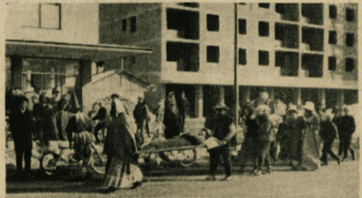
Pokopavanje pusta, star ljudski običaj — danes pa izraz želje, da bi se pustni čas čim bolj podaljšal. »Sprevod« v Domžalah

Kdaj bo objavljen rezultat antekete o otroškem varstvu?