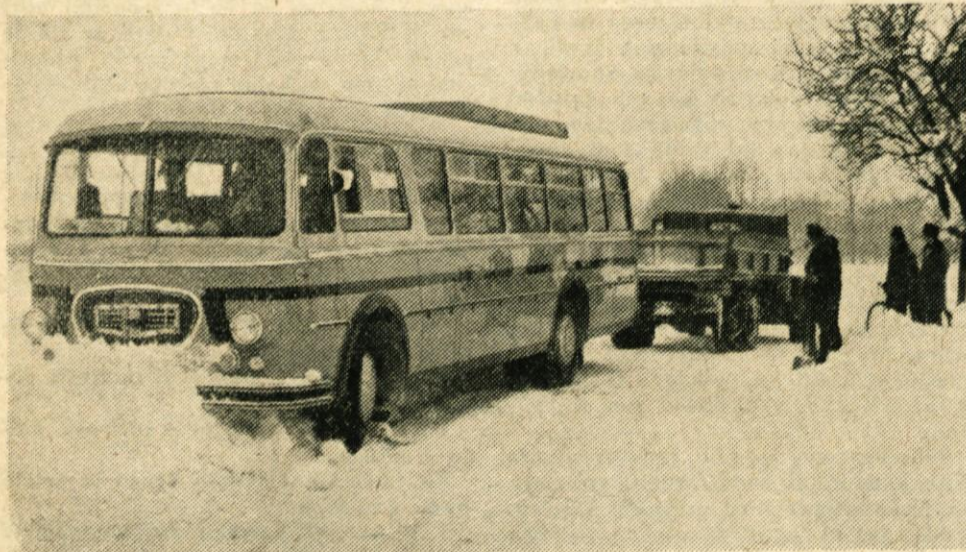
Visok sneg je zaustavil tudi moravški avtobus. Le s tujo pomočjo se je lahko osvobodil snežnega objema in nadaljeval vožnjo. (V spomin na šoferske težave v letošnji hudi zimi)

V letu 1962 smo za našete uporabnike obdelali 481.997 plačilnih dokumentov in izdelali 44.155 dnevniških izpiskov, s čimer se po doseženem obsegu dela uvrščamo v Sloveniji na 19. mesto od skupnih 58 podružnic. Zaradi stalnega povečevanja obsega dela prekoračujemo republiško povprečno obremenitev na uslužbenca za 10 odstotkov in bi po takem povprečju na temelju izračunov republiške centrale potrebovali še 6 uslužbencev.