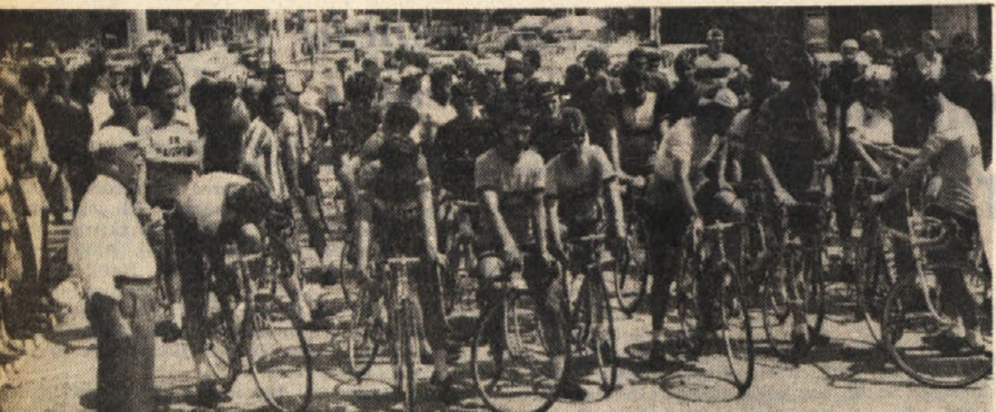
Kolesarji v Sosljanu pred startom 7. etape, ki jih je popeljala do Bovca