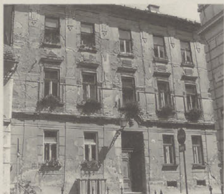
Prešernova ulica 32 na Ptuj, pred prihodom delavcev Gradbenega remonta...

od novih ali obnovljenih zasebnih hiš? Morda kar njihova upravna hišica na Žnidaričevem nabrežju ali pa ob njej gradbeno skladišče? Ker je odločitev zares težka, preskočimo tja, kjer so delavci Gradbenega remonta potrdili tudi svojo strokovnost in pokazali ljubezen do mesta, v katerem živijo ali vsaj delajo: v Prešernovi ulici so temeljito polepšali in obnovili hišo, ki ima nad vrati številko 32. Marsikdo je že pozabil, v kakšnih raztrganih oblačilih je stala še pred dvema letoma. Zdaj se nam zdi, kakor da je samoumevno zlikana in čista, a na naborke njenih oblačil, nad njena radovedna okna in med njih je bilo treba vrniti toliko drobnih in natančno oblikovanih elementov, ki smo jih bili v preteklih desetletjih pohodili na pločniku, kamor so odpadli, da bi zdaj že zdavnaj pozabili, kakšno delo so opravili, če... Če ne bi bilo vsaj kakšne slike, ki spominja na razdrapano preteklost mestne hiše. In ko vam bo ostala minuta časa, stopite na dvorišče hiše na Prešernovi 32 (tokrat je tudi na naši naslovnici). Isti mojstri so bili zraven, le to vam lahko prišepnemo.