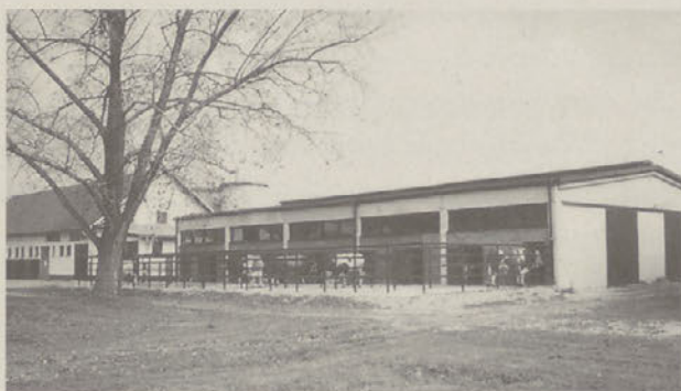
Novi hlevi v Obdravskemu zavodu za veterinarstvo in živinorejo na Ptuj

Pri iskanju dela za druge naročnike pa so doslej bili že velikokrat uspešni in ponekod jih povabijo tudi naslednjč ko potrebujejo dobre mojstre. Ko so na primer Obdravskemu zavodu za veterinarstvo in živinorejo na Ptuj zgradili hlev za plemenske bike, ni bilo več vprašanje, kdo bo kasneje gradil še hlev za plemenske