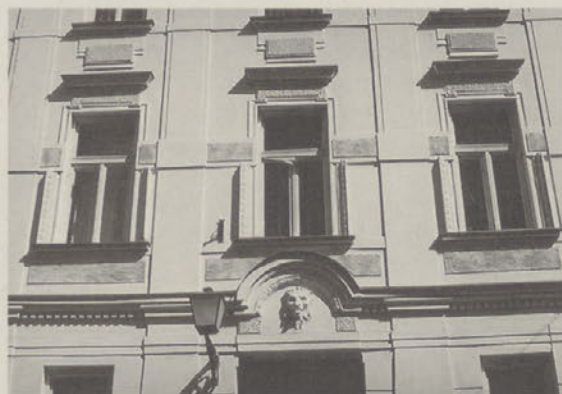
...in isto pročelje po njihovem odhodu *