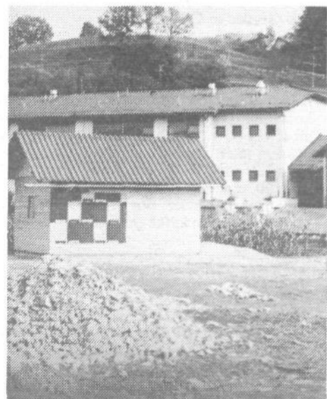
Na ploščadi pred osnovno šolo »Levstikove brigade« so postavili čebelnjak in kmalu bodo poudili škofljiški šolarjem še eno zanimivo prostorsko dejavnost