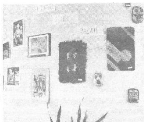
V avli občinske skupščine je v mesecu otroka na ogled razstava, ko so jo v organizaciji Zveze prijateljev mladine in Zveze kulturnih organizacij pripravili viški pionirji in cicibani na temo Sodelovanja, mir, razvoj.