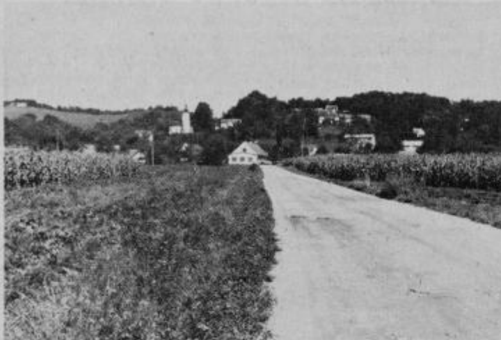
Pogled na Podgorce

Prihodnjic bomo spregovorili še o nekaterih drugih načrtih te krajevne skupnosti.