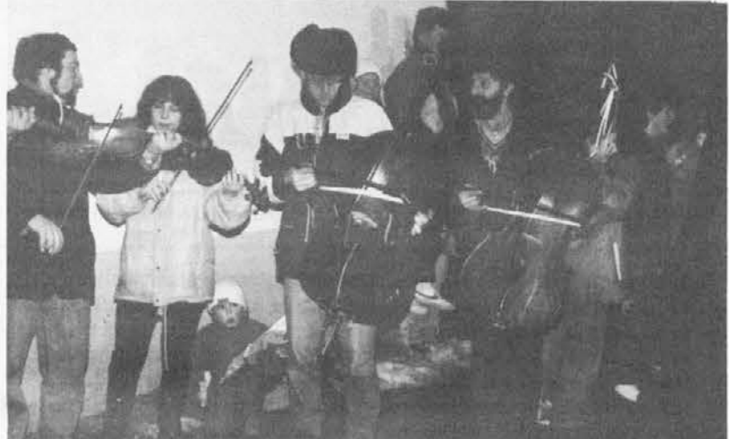
Per la prima volta abbiamo visto suonare la «citira» una donna