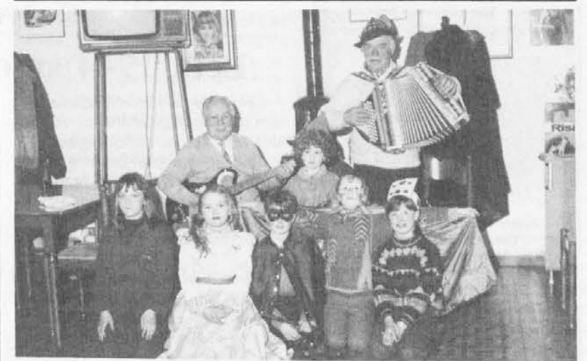
Udinese club iz Špietra ne pusti iti napri obednega praznika brez ga praznovat an takuo se je zgodilo tudi za pust.

PALLAVOLO FEMMINILE Paluzza 22; Gemona, Cassacco, Asfjr Cividale 18; Comeglians 12; Cra Faedis 10; Terzo, Remanzacco 8; Pol. S. Leonardo Apic. Cantoni, Gornars 6; Percoto 4; Santamaria 0.