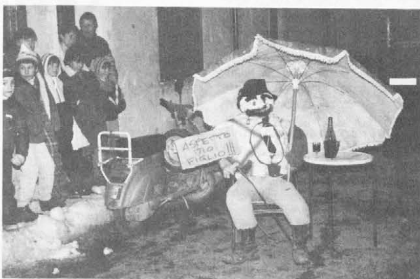
Dopo l'ultimo desiderio dei condannati: den litro vina ta za no taulo sri poti pod ni mu vlikimo ombreluno, de luna ga ni purusej

Pa litos je se delal den prave pust. Tu parokje na Ravanci te utroške pust. Prve stopice na den stare anu nove pust, pa te nej bujē mali kobojal za det no dancijo, usaki siort maškaričou. Anu za si pulipet pa to bočico te žinice so