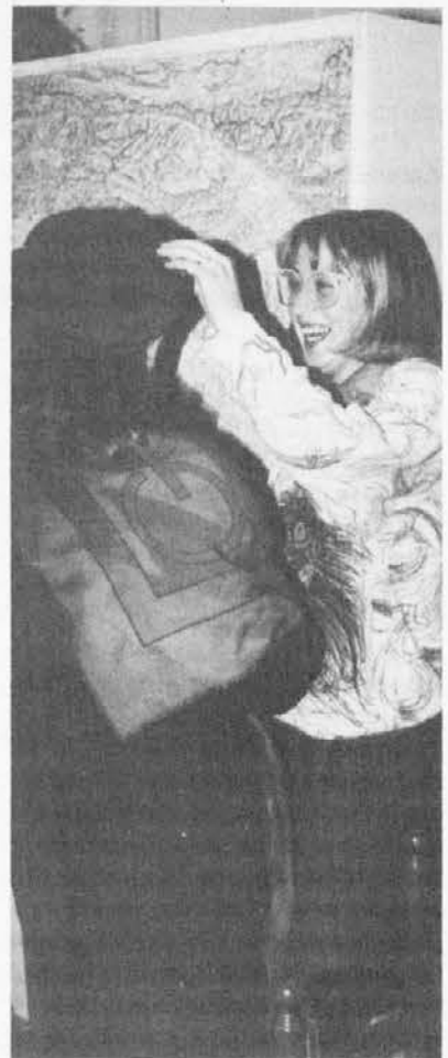
Il piacere di incontrarsi