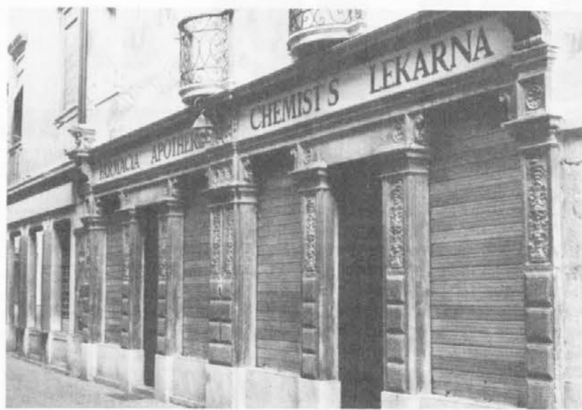
Motiv iz Čedad: zaries ni mogoče se zgrešit