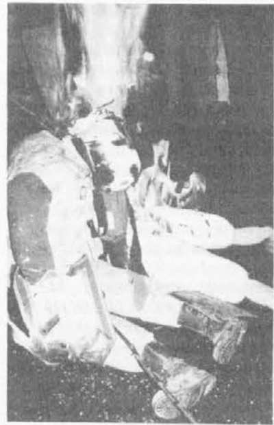
Il rogo dei due «babac» padre e figlio