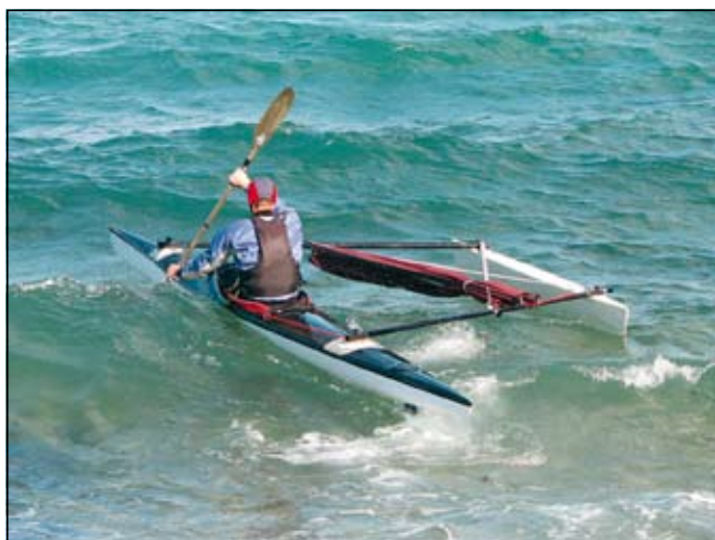
Slika 1. Katamaranska prototipna izvedba jadralnega kajaka