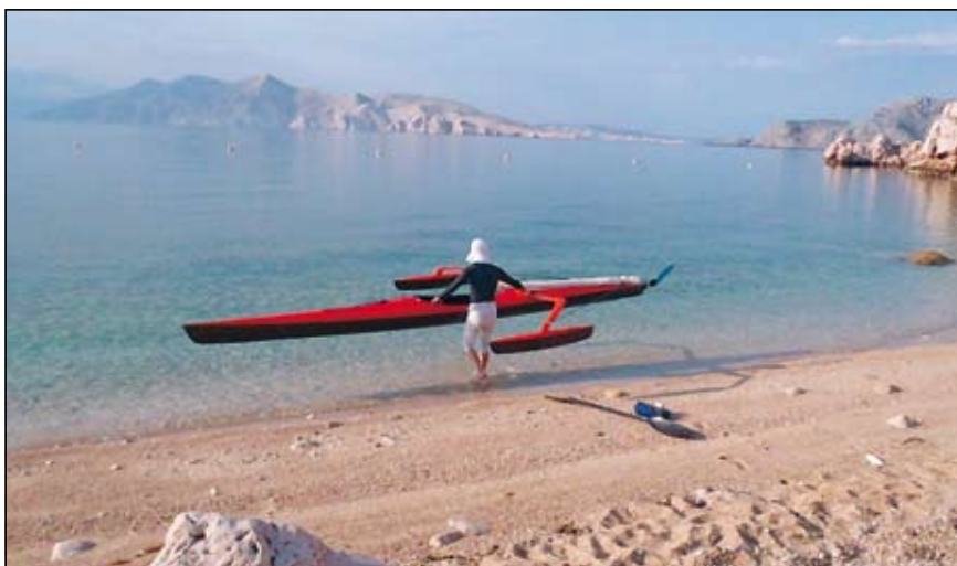
Slika 10. Prenašanje iz obale v vodo

trimaranske zgradbe: patent št. 22790 SI. Ljubljana: Urad RS za intelektualno lastnino, 2010.