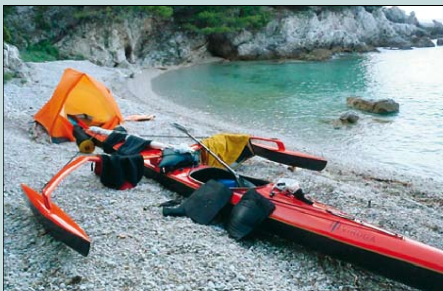
Slika 3. Zavešje na Pelješcu po celodnevem jadraniu

skimi valovi, ki so očitno še posledica nočnega divjanja in se sedaj skupaj z odboji od obale sestavljajo v nepredvidljivo morskno igro. Spremljajo me tudi nevihte, tako da se zaradi številnih strel raje držim bližine obale. Nazadnje me doleti še toča in si po prvi buški zatlačim pod kapo nekaj zaščitnih cunj. V resnici pa mi prav nič ne manjka, v čolnu sem vsaj varen pred poplavami.