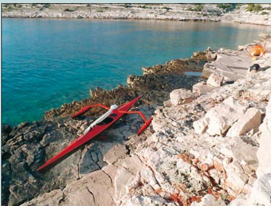
Slika 1. Bivačiranje na kamnitih ploščadih Žirja

njimi čudovito, z iglicami posuto ravnico za bivačanje. Pred opoldansko vročino se skrijem v senco konobe v Saliju, potem naprej proti Kornatom, kjer dočakam že težko pričakovani mastral. Potovanje se nadaljuje z dvignjenim jadrom in kilometri se začnejo nabirati hitreje. Popoldne sem že mimo Kornatov, mastral pa ima še dovolj moči, tako da se odločim še za izpostavljeno prečenje proti otoku Žirje, kamor prispem že v mraku in postavim bivač na ravnih kamnitih ploščadih, ki se spuščajo do morja ( slika 1 ).