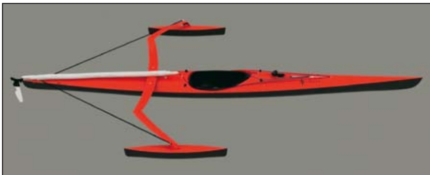
Slika 3. Oblikovanje jadrlnega kajaka, postavitev za veslanje

Za obe različici je bila posebej razvita palična zgradba zložljivega jadra, ki izpolnjuje prvo projektno zahtevo in omogoča postavljanje in zlaganje jadra ter njegovo upravljanje iz centralno nameščenega kokpita plovila. Ker se je za uporabo izkazala bistveno prikladnejša trimaranska zgradba, je bila ta izbrana za naslednjo fazo projekta.