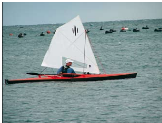
Slika 8. Uporaba: jadranje

veslaških pogojih (slike 7–9) in se je s svojimi lastnostmi odlično izkazal pri različnih uporabah, vključno z daljšimi večdnevnimi odpravami.