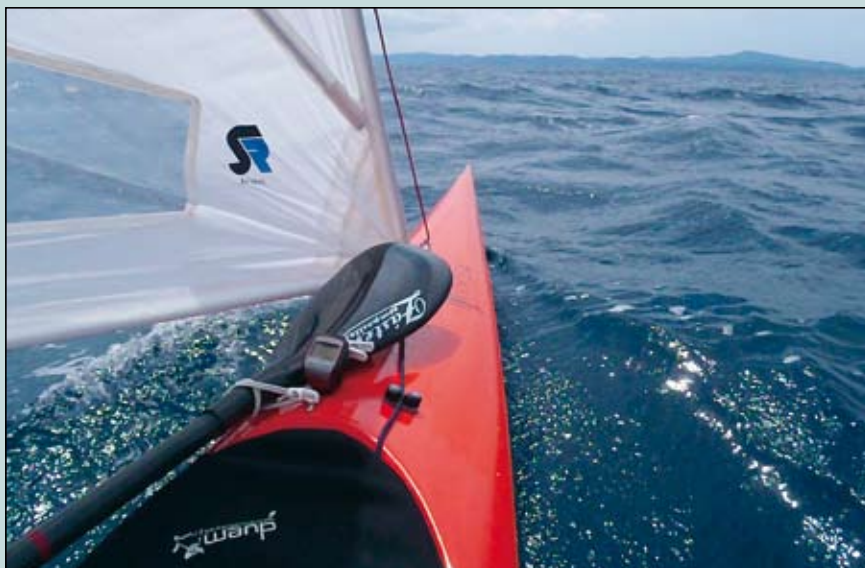
Slika 2. S polnimi jadri proti Korčuli

Veslanje mimo Dubrovnika spremlja precej kaotično morje z nekajmetr-