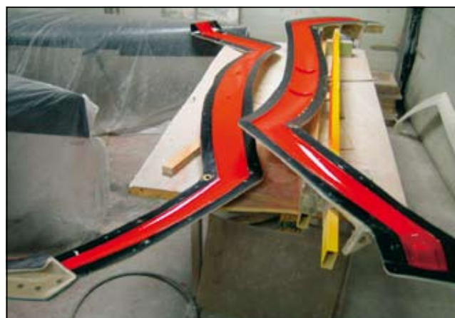
Slika 6. Priprava kalupov za prečko

no zgradbo na osnovi ogljikovih vlaken in postopek vakuumske infuzije. Slika 5 prikazuje infuzijo glavnega trupa.