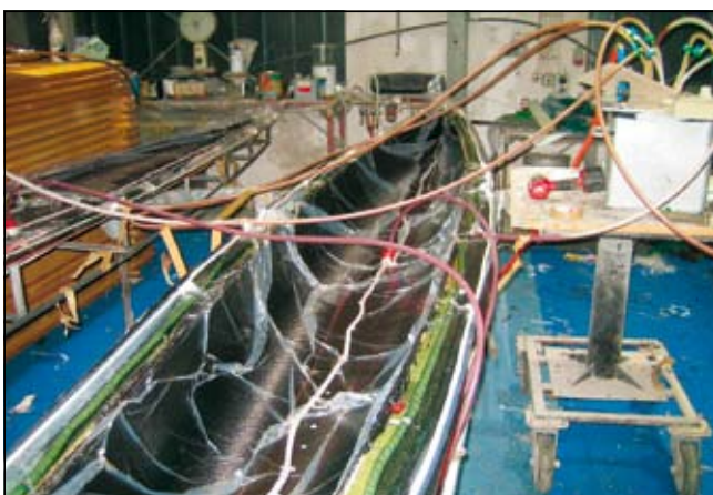
Slika 5. Vakuumska infuzija glavnega trupa

Izdelani jadrlni kajak je bil izčrpno preskušen v različnih jadrlnih in