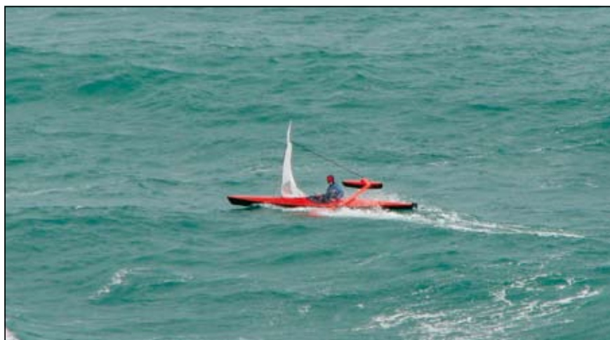
Slika 9. Jadrnanje v močnejšem vetru