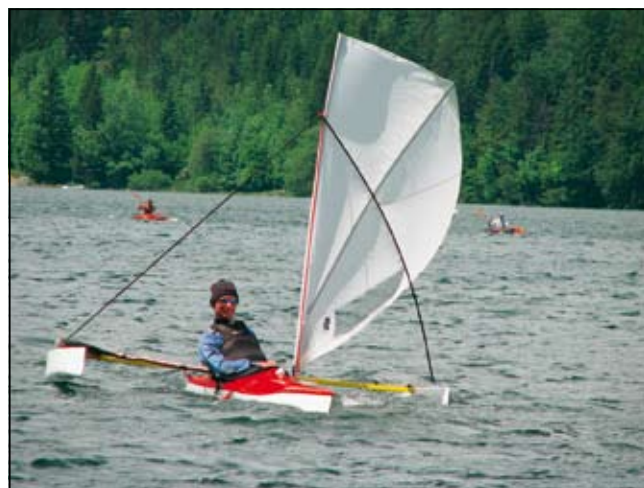
Slika 2. Trimaranska prototipna izvedba jadralnega kajaka

V članku je na kratko predstavljena pot razvoja od ideje do končne izvedbe projekta Viroga. Projekt je bil