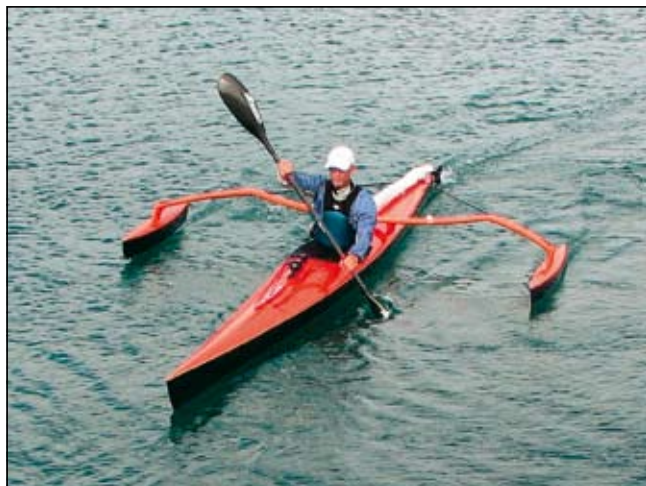
Slika 7. Uporaba: veslanje