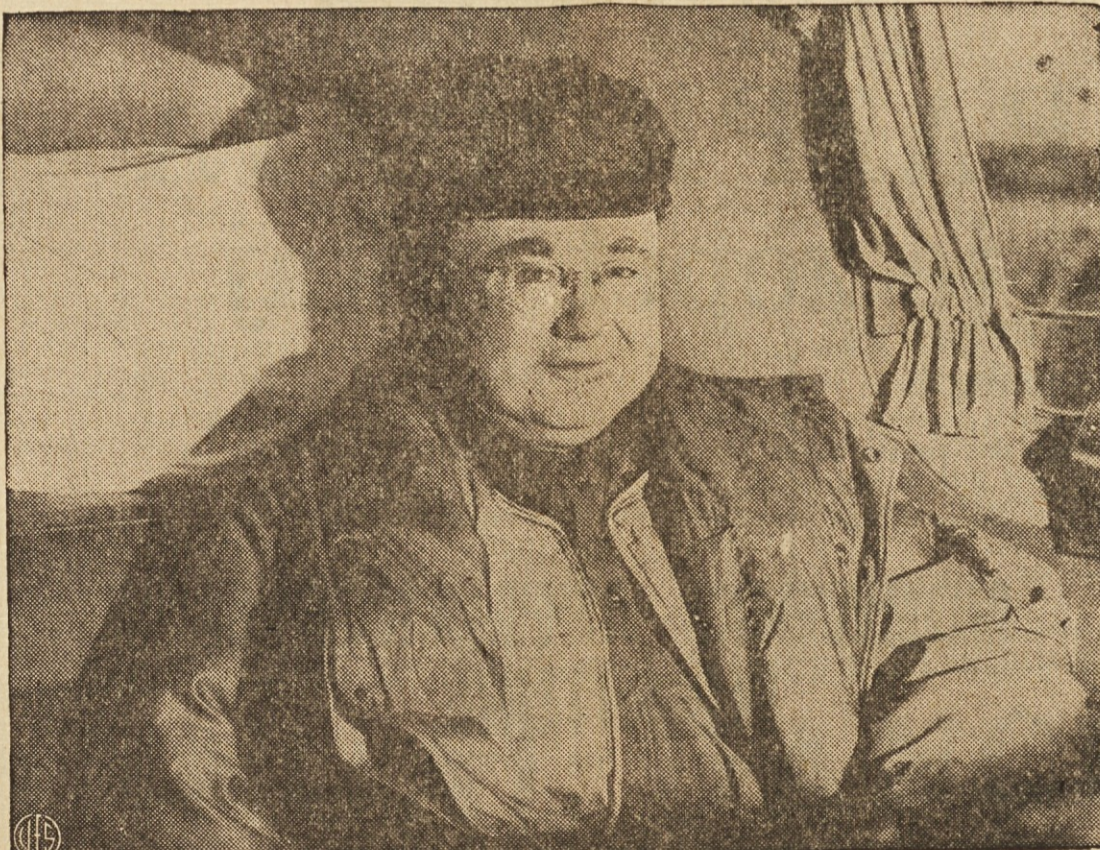
PRED ODHODOM — Opravljen za mrzlo korejsko zimo čaka kardinal Francis Spellman na nekem korejskem vojaškem letališču na povratek v domovino. Kardinal je tudi zadnji božič obiskal ameriške vojske na Koreji.

Prosto stanovanje dobi starejša ženska, ki bi vršila lahko hišno delo. Svojo sobo in uporaba stanovanja. Na 1000 E. 66th Pl. Kličite SW 5-3287. (22)