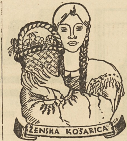
(Zbira Vera K.)