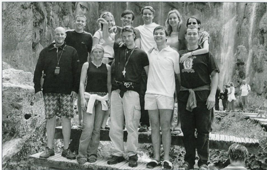
V nacionalnem parku Plitvice na Hrvaškem

Problemov z izbiro kampa ni bilo, kajti v nacionalnem parku obstaja samo en, Korana, imenovan po bližnjem kraju. Po preležanem petku smo se naslednji dan podali na ogled narodnega parka Plitvice, za kar smo odrasli odšteli po 90, otroci pa 55 kun. Urejenost parka si zasluži čisto desetko! Ogled obsega hojo po sprehajalnih poteh ter vožnjo z ladjo in na koncu vlakcem. Jezera so čudovita, voda kristalno čista, vendar pozor, kopanje prepovedano! Zato smo poiskali, po napotkih domačinov, nekakšno kopališče na črno v reki Korani. Izlet je v celoti uspel, vreme je bilo čudovito, izostali pa lahko samo obžalujejo, da jih na tej ekskurziji ni bilo. Avgusta je nastopil čas za motoristično akcijo. Po celoletnih načrtih smo se štirje člani opogumili in se na treh motorjih odpravili na krožno pot po Pirenejskem polotoku. Pot nas je vodila preko Italije in