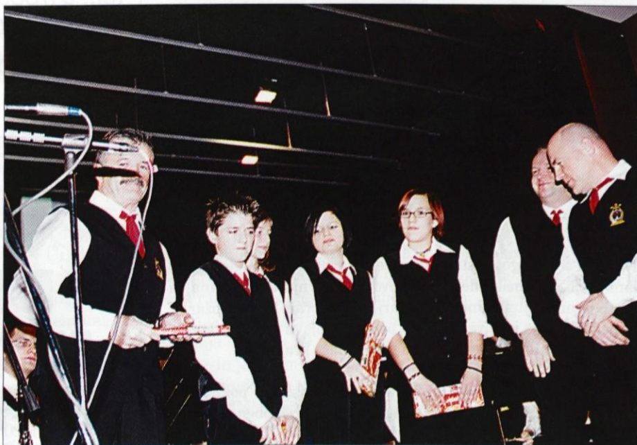
Predstavili so se novi člani Godbe Lukovica.

Sledili so že prvi gostje, in sicer otroci iz Vrtca Medo, ki so se predstavili z dvema pesmima ter s svojo prikupnostjo in spon-tanostjo navdušili obiskovalce. Da Godba