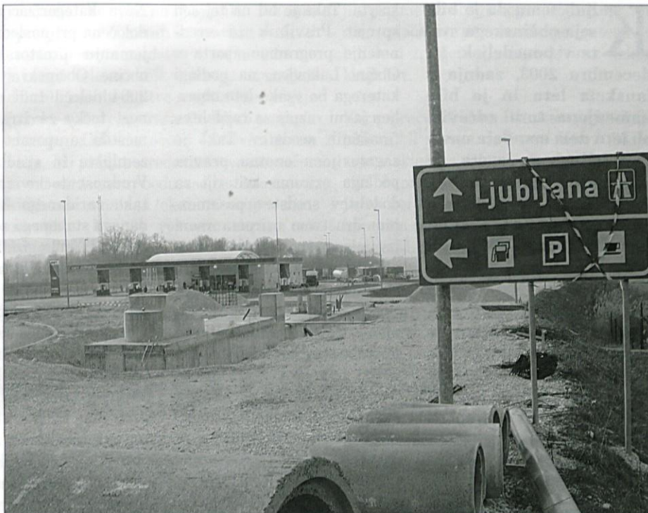
Gradnja cestninske postaje v Lukovici.