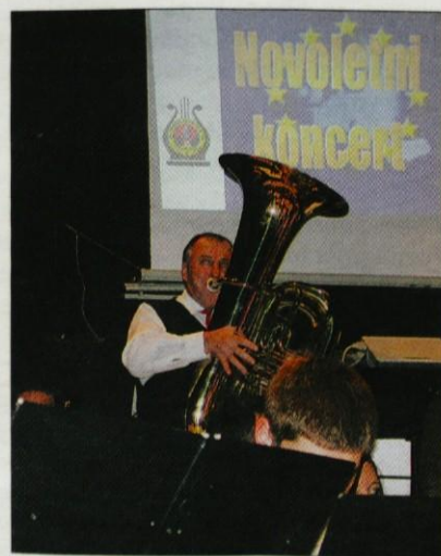
Nov instrument je godba dobila po zaslugi donatorja.