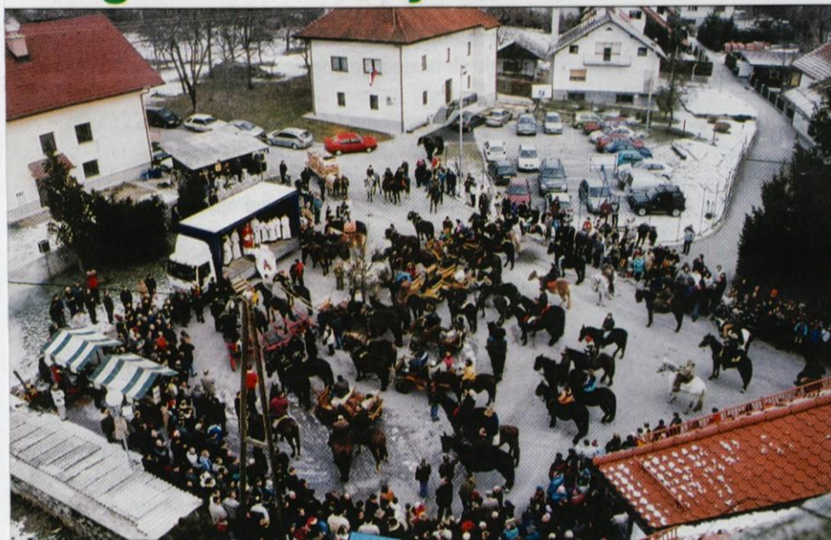
Dan državnosti in blagoslov konj

P red cerkvijo sv. Vida v Šentvidu smo tudi letos praznovali dan samostojnosti. Konjerejsko društvo Lukovica je osmo leto pripravljalo blagoslov konj in s tem ohranja star ljudski običaj. Ta običaj je povezan s prvo omembo cerkve sv. Vida pred 699 leti. 26. decembra gođuje sv. Štefan, ki je v cerkvi sv. Vida na stranskem oltarju. Sv. Štefan je zavetnik in zaščitnik domačih živali, zato na ta dan vsak gospodar pripelje blagoslovit konje. Blagoslov konj po ljudskem izročilu ohranja na poti in v hlevu zdrave živali, na polju pa dobro letino.