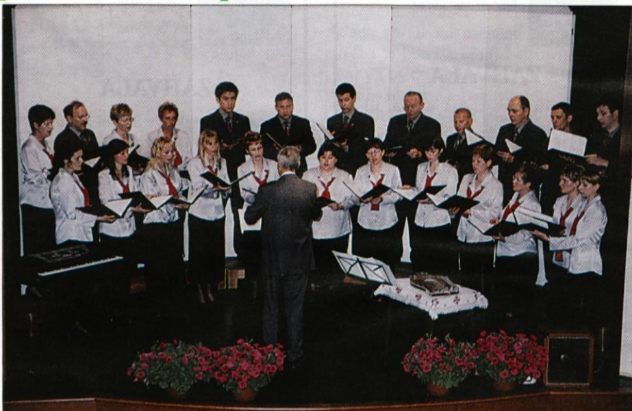
Na enem od božičnih koncertov šentviških pevk in pevcev.

Gostovanje pri sv. Tomažu pri Ormožu je bilo spet posebnost. Na pot se je bilo treba odpraviti že zgodaj v nedeljo, 28. decembra, da smo prispeli do maše ob 10. uri.