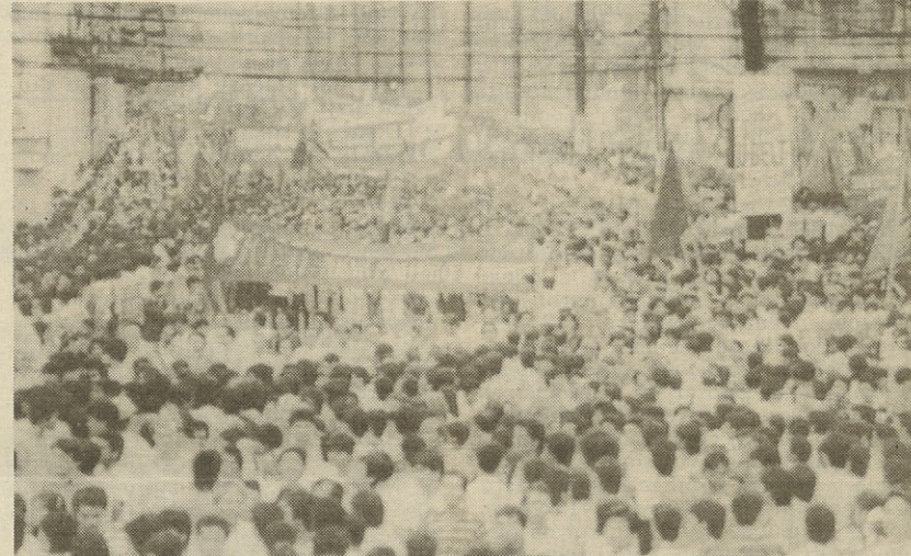
Fotografski posnetek včerajšnje demonstracije v Manili

Medtem ko se na Filipinih pripravljajo na skorajšnji referendum za sprejetje nove ustave, pa se v Manili širi vest, da so četkovo streljanje na kmete sprožili Marcosovi vrinjenci v policijskih odredih predsedniške straže.