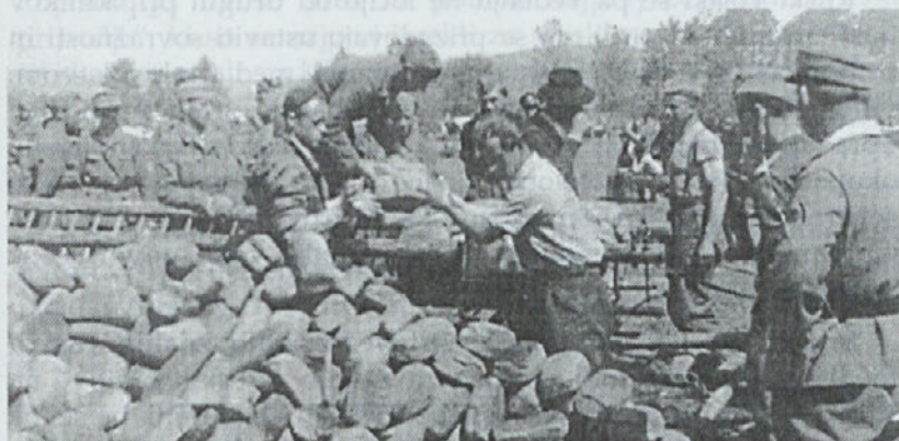
Vetrinje, maj 1945