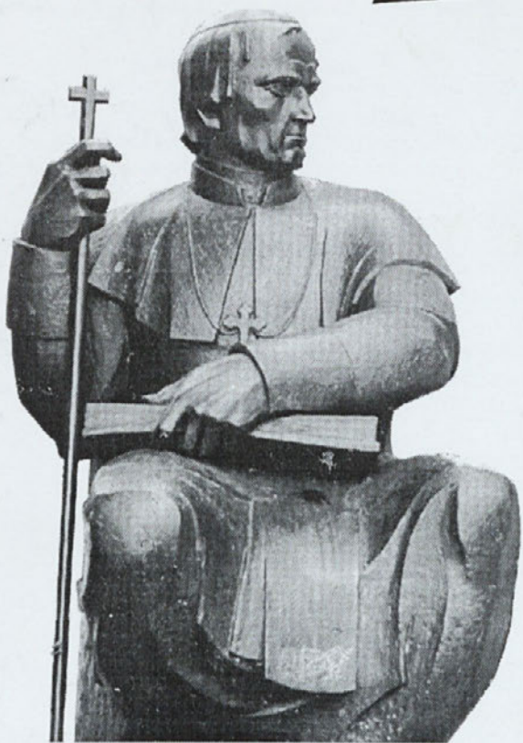
ANTON MARTIN SLOMŠEK Utrdi nas v veri v tvoji resnici!