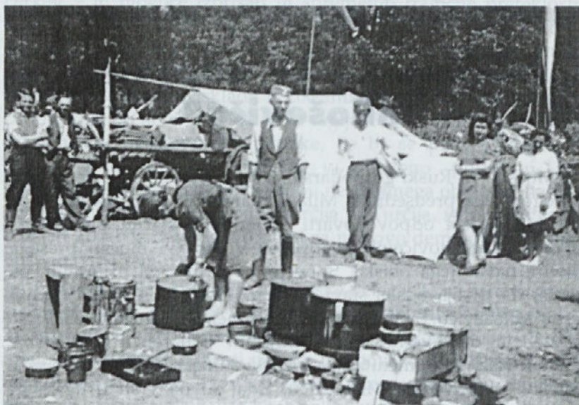
Kuhinja Smledniške posadke, Vetrinje, maj 1945