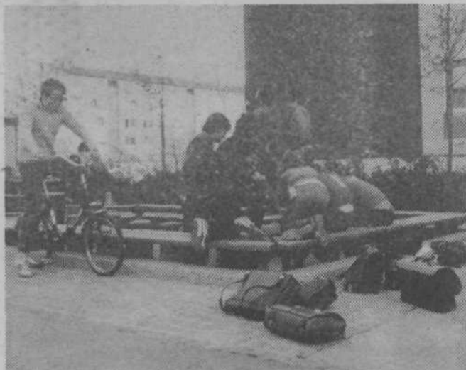
Po pouku igra v peskovniku