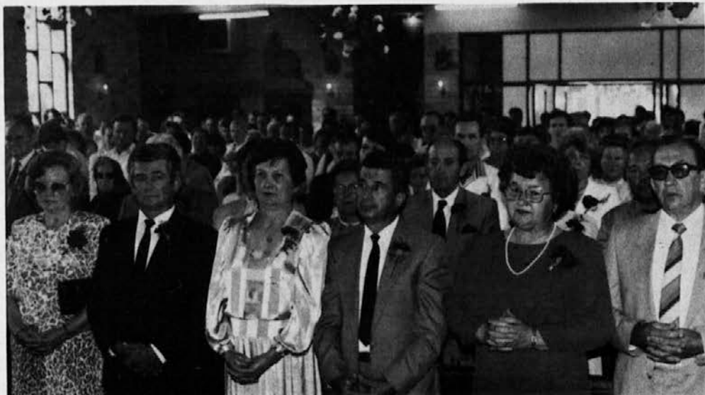
Pri Sv. Rafaelu v Sydneyu ob letošnjem žegnanju. Spradaj so jubilejni zakonski pari.

VANDALIZEM je problem, katerega se človeška družba skuša režiti na vse načine, pa skoraj zaman. V Avstraliji povzročajo mladi vandali vsako leto milijonsko škodo. Ti ljudje, ki so bolni v duši, nimajo nobenega spoštovanja do sočloveka. Saj še pokojnim ne prizanesejo. Celo pokopališča so redna prizorišča njihovega razdiralnega besnenja. Tudi naše pokopališče v Rookwoodu je utrpelo že velikokrat škodo. Nedavno je bilo spet poškodovanih nekaj nagrobnikov, cvetje z vazami razmetano po grobiščih, marmornati križ