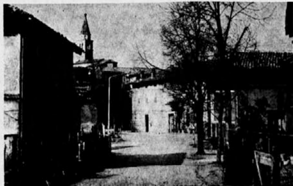
Kozana, vas blizu Nove Gorice