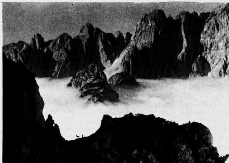
Pogled s Svetih Višarj na gorske velikane in megleno morje

Bili so delo Tvojih rok, bili so mejniki za Tvojo pot, glas za Tvoj klic, tečajji za Tvojo dver. Zdaj so olje za našo luč. Daj jim Svoj mir!