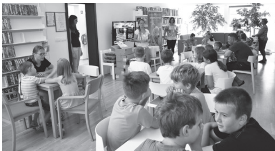
Mladi ustvarjalci ob prvem stiku z LEGO zgodbami