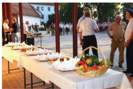
Arhiv fotografij iz 2016, Foto Zalar

vedno presunilo s svojo lepoto in z mnogimi vrstami rastlin in živali, ki jih lahko najdemo tam. Jezernika nismo razjezili, saj se je iz ure v uro vreme le toplilo in izboljševalo. Na poti nazaj smo se ustavili še na učni poti, kjer smo preizkusili tamkajšnje naprave in se naučili kaj novega o gozdu. Po kosilu smo imeli prosto. Uživali smo lahko zunaj ob podajanju žoge ali notri ob druženju na delavnicah. Po večerji smo si omislili disko, usposobili disko kroglo in večer preživeli ob plesanju in glasbi. Sobota: Zbudili smo se malo kasneje, saj zadnji dan nismo imeli jutranje telovadbe. Večina si je stvari spakirala že v petek, preostali pa so to naredili pred njem. Kovčke smo iz sob prenesli na avtobus, ki nas je že čakal, se posedli in počakali, da smo se vsi zbrali. Odrinili smo malo prej, kot je bilo predvideno, in se mirno odpeljali v dolino. V Ormožu so nas že nestrpnost čakali naši najbližji. Izmenjali smo si še zadnje besede, se poslovili in veselo zaključili še en tabor na najlepši strani Pohorja, ki ga bomo zagotovo ohranili v lepem spominu.