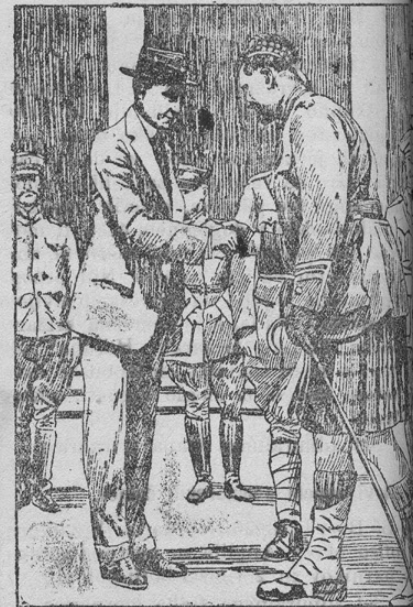
In New York Londoner Balettratten als Werber in Amerika

Amerikanske vojne grožnje so ostale brez vsacega uspeha na osrednje S kakimi sredstvi nabirajo Amerikanci ke, nam kaže naša slika. Moški in igralci ponočnih baletnih lokalov vabijo