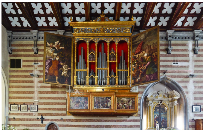
Sl. 11. Valvasone, duomo. Vincenzo Colombo, 1533. (jd)

Krilna vrata sta leta 1535 naslikala Giovanni Antonio de' Sacchis, znan tudi kot 'Pordenone', in Pomponio Amalteo (Motta di Livenza 1505 – S. Vito al Tagliamento 1588). Leta 1552 je Amalteo izdelal zidne poslikave ob straneh orgelske omare in pet slik na table zunanje strani korne ograje.