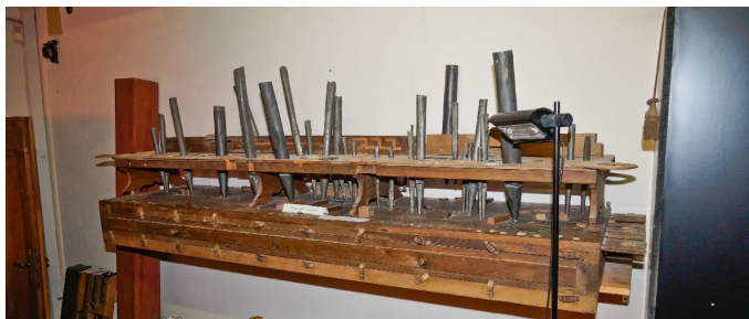
Sl. 12. Valvasone, duomo. Stara sapnica.