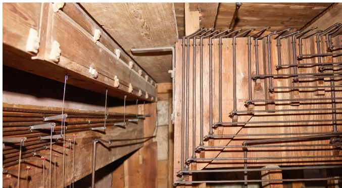
Sl. 8. Stolnica v Vidmu (Udine). Pedalna in registrska traktura. (jd)