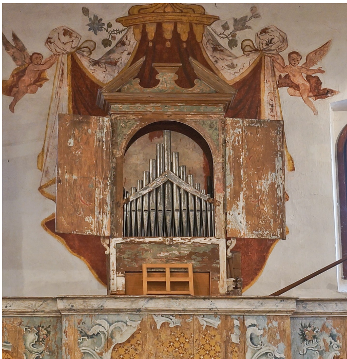
Sl. 12. Valvasone, S. Pietro e Paolo. (jd)