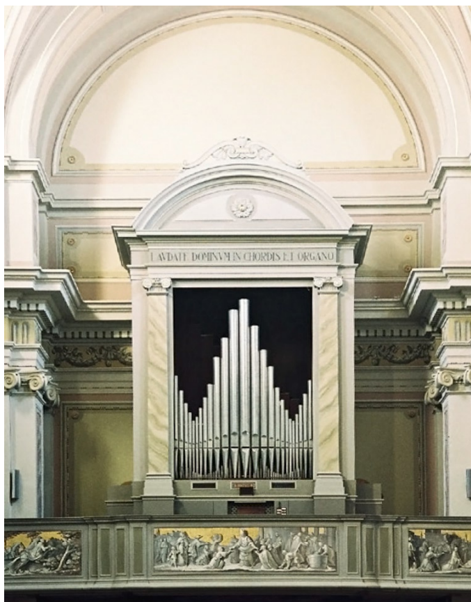
Sl. 6. Zaninove orgle v Talmassonsu iz leta 1850.