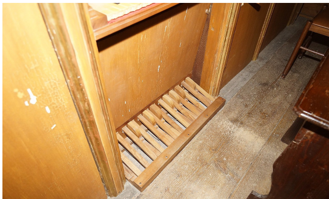
Sl. 11. Valvasone, duomo. Rekonstruiran pedal je izjemno kratek. (jd)