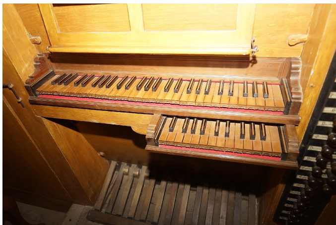
Sl. 9. Stolnica v Vidmu (Udine). Klaviature. (jd)