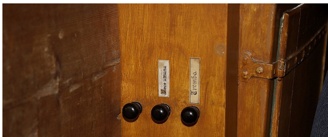
Sl. 10. Stolnica v Vidmu (Udine). Registrski potegi hrbtnega pozitiv. (jd)