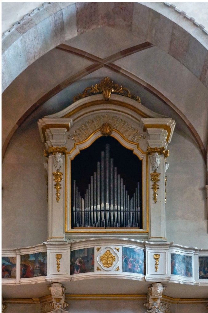
Sl. 4. Daccijeve orgle v Huminu, ki so bile močno poškodovane ob potresu 1976, so danes odlično restavrirane. (jd)

Naj ob koncu poglavja o orglah zunanjih orglarjev omenim še dve glasbili slavnih beneških orglarjev 18. stoletja, Gaetana Callida (1727–1813) in njegove orgle v Venčonu (ital. Venzona), ter Francesca Daccija z orglami v stolnici v Huminu (ital. Gemona). Oboje so bile po poškodbah ob strašnem potresu leta 1976 odlično restavrirane.