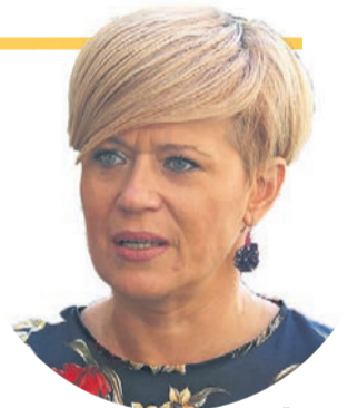
Aleksandra Pivec

Po mnenju ministrice za kmetijstvo Aleksandre Pivec so pripombe neutemeljene, zakon pa je popolnoma usklajen z ustavo. »Pobudniki niso natančno konkretizirali škodljivih posledic, ki naj bi nastale zaradi začetka izvrševanja zakona, s tem tudi niso izkazali pravnega interesa, ki mora biti neposreden in konkreten. Zato vlada ustavnemu sodišču predlaga, naj pobudo trgovcev zavrže,« meni Pivčeva, ki ob tem tudi dodaja, da lanska sprememba zakona o kmetijstvu niti ni prinesla večjih sprememb. »Novela ne opredeljuje novih tipov nedovoljenih ravnanj ali jih širi. Gre zgolj za natančnejšo opredelitev takrat veljavnih določb in nedvoumno opredelitev nedovoljenih ravnanj. Hkrati gre tudi za lažje izvajanje nadzora nad nedovoljenimi ravnanji,« je še povedala ministrica.