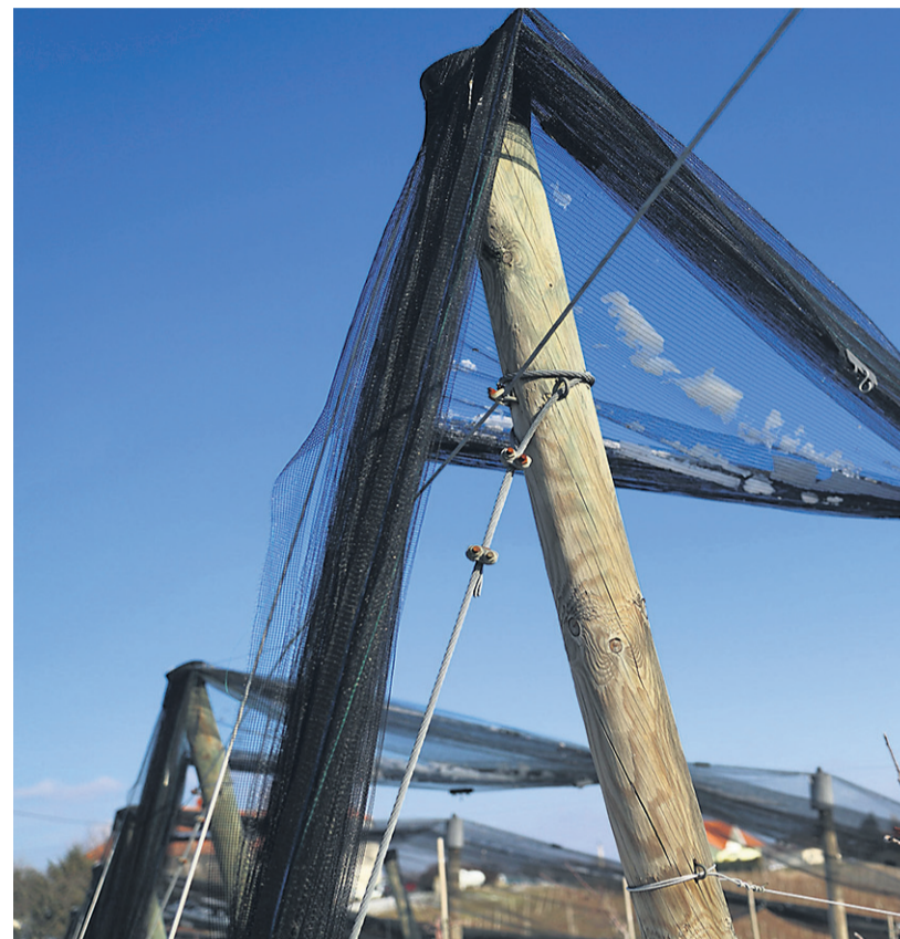
Novost je 50-odstotno sofinanciranje zavarovalne premije za zavarovanje posevkov, poslov. Višje je tudi sofinanciranje zavarovalnih premij za boleznih živali.