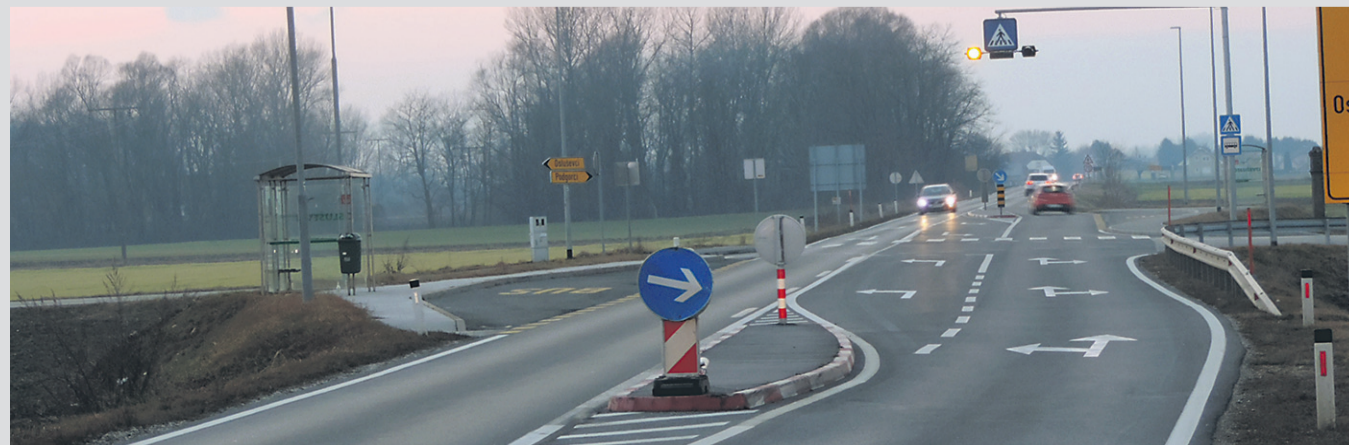
Prometni otok v križišču v Osluševcih je v temi, saj ga javna razsvetljava z ene strani slabo pokriva, opozarjajo ormoški policisti. Na cestnih otokih je neredko opaziti podrt prometne znake.