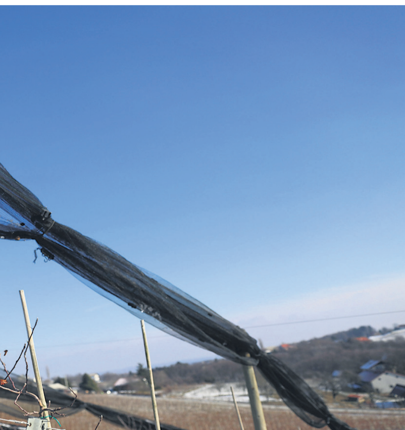
nasadov in plodov. Sofinanciran bo tudi pripadajoči davek od prometa zavarovalnih

zavarovanja. V zadnjih letih se je namreč bistveno poravnala razmeroma majhen delež škode, v nekaterih