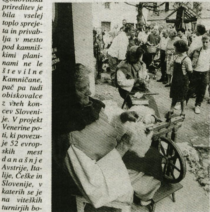
Tudi letos bomo spremljali dogajanja na srednjeveški tržnici, kjer bodo predstavljali nekdanje živče obrti v Tuhinjski dolini.

oživiti srednjeveško življenje mesta, razumevanje življenja v tistem obdobju in predstaviti nekoliko drugačno turistično ponudbo. Vsebinska podoba prireditve bo letos nekoliko spremenjena in po mnenju organizatorja še bolj privlačna, saj so poleg prireditev, ki so na