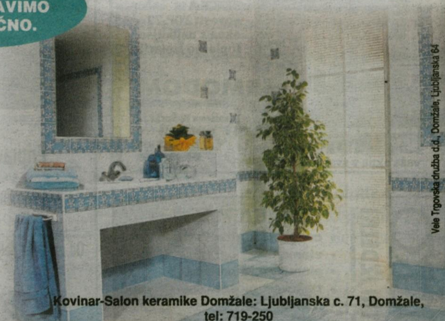
Vele Trgovska družba d.d., Domžale, Ljubljanska 64