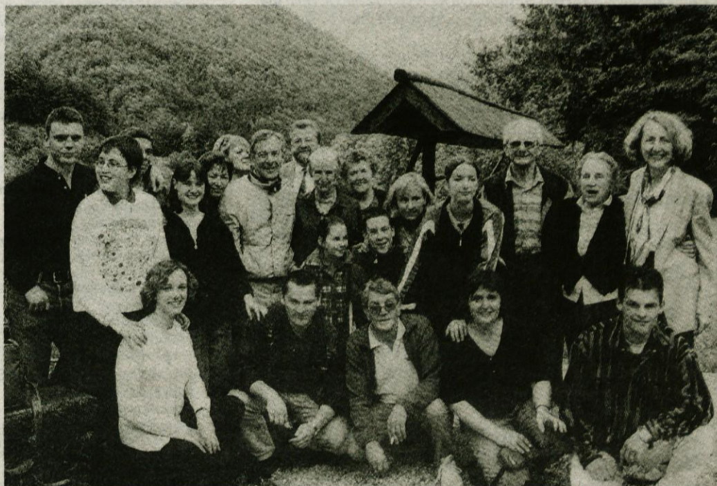
Sorodniki so uglednemu politiku iz ZDA pri smučarski koči v Repšah priredili prrščen sprejem