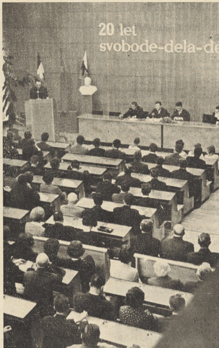
20 let svobode-dela-de