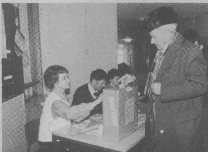
Starejši občani so po večini volili že v jutranjih in zgodnjih dopoldanskih urah. Ravnali so se po življenjskem vodilu, da če že nekaj name-ravaš, to čimprej opraviš