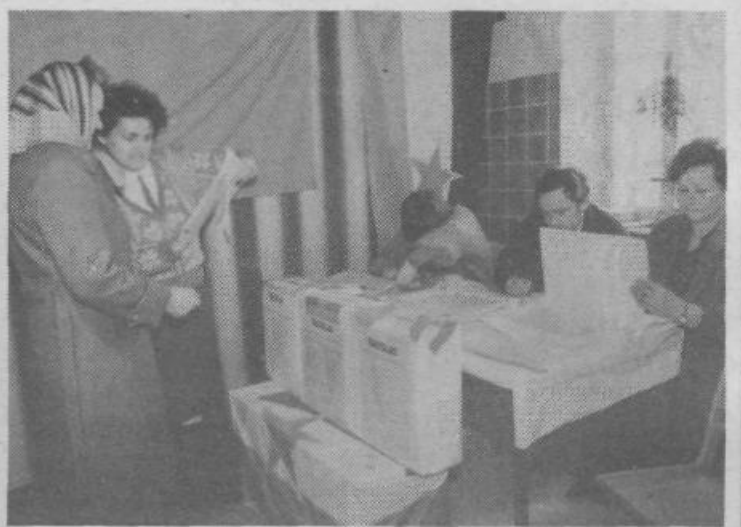
Zaradi obsežnega delegatskega sistema je tudi glasovalni postopek tak in zahteva kar dobra pojasnila, da ne pride do nenamernih napak