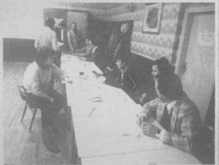
V zadnjih urah so številna volišča postala prazna, na člane odborov in komisij pa je že legla utrujenost. Kako da ne, dan je bil odgovoren in naporen. Hvala jim