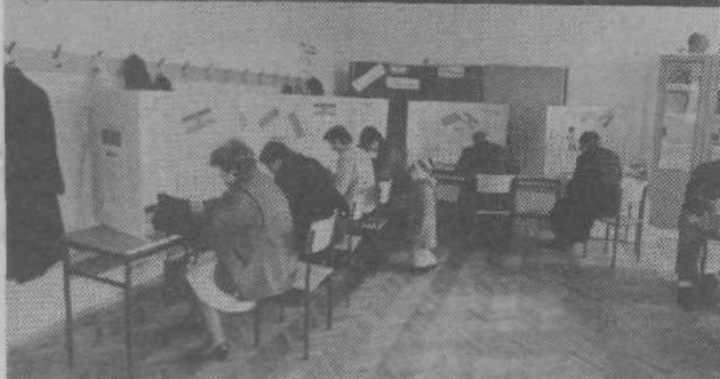
Za tajnost volitev je bilo na vseh voliščih primerno poskrbljeno. Seveda pa je bilo to v velikih prostorih lažje zagotoviti kot v majhnih, saj vemo, kako številni so in koliko prostora zavzamejo že volilni odbori