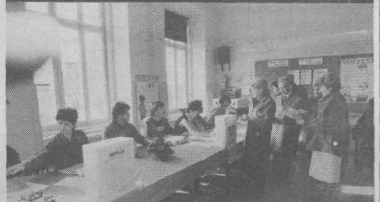
Prostorne in svetle učilnice naših šol so se 16. marca v velikih primerih spremenile v najbolj urejena volišča