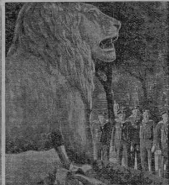
Italijani so prepeljali po osvojitvi Abesinije pred 5 leti v Rim iz abesinske prestolnice Addis Abebe na slikli vidnega ogromnega kamenitega leva

Vi imate les, drva, pa bi radi krompir ali žito, v drugem kraju imajo krompir in živež, potrebujejo pa drva za zimo. Kako boste naredili kupčijo, ko smo tako daleč narazen in drug za drugega ne vemo? — Oglas v »Slov. gospodarja«!