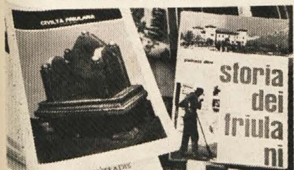
Knjižna razstava na Obirskem je udeležencem nudila bogat pregled slovenske literarne ustvarjalnosti. Na ogled pa so bile tudi knjige v furlanščini. Pisatelji so pozdravili tudi iniciativo knjigarne „Naša knjiga“, ki jim je na licu mesta nudila še dodatno izbor knjig iz svojega repertoarja.